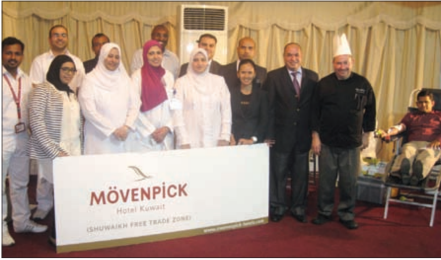
لقطة تذكارية لفريق بنك الدم وموفنيك المنطقة الحرة