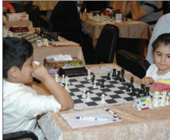
مشاركة من الاطفال