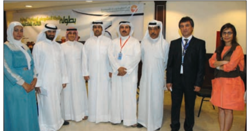
اللجنة المنظمة والحكام

الكويتي للألعاب الذهنية في نادي اليخوت أحد مرافق شركة المشروعات السياحية، وتتضمن البطولة فئة الرجال السيدات والناشئين وقد رصدت إدارة النادي جوائز قيمة للفائزين والفائزات