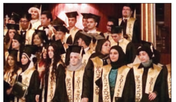
خريجو المدرسة الباكستانية اثناء حفل التكريم