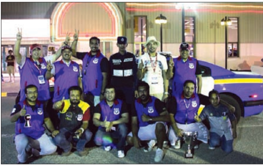
اللجنة المنظمة مع رجال الداخلية

استحسان وإعجاب رواد المنتزه وقد انطلقت مسيرة الكورفيت برحلة العودة مصحوبة بتمنيات الحضور من الجمهور بالعودة السالمة مع مزيد من المهرجانات المماثلة الناجحة.