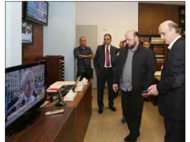
المرشح الرئاسي سمير جعجع يتابع اليوم الانتخابي من معراب (محمود الطويل)