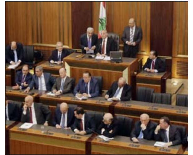
رئيس مجلس النواب نبيه بري مترشحا للجلسة الأولى للانتخابات الرئاسية