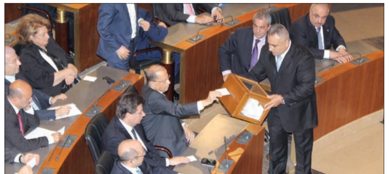
النائب ميشال عون يبلي بصوته في الجولة الأولى من الانتخابات الرئاسية

مرحلة لاحقا، لا الآن، وذلك في انتظار استكمال عملية إنضاج ظروف انتخابه. وفي اعتقاد هذه الأوساط ان وضع عون في مواجهة ومنافسة مع جعجج لا يجوز، لأن من شأن ذلك أن يشوه فلسفة مقاربتة للاستحقاق الرئاسي، وقوامها النأي بنفسه عن الاصطفاة التقليدية والكتابات اللبنانية، وصولاً إلى تحقيق المصالحة بين مفهومي القوة والوفاق، بحيث يتكامل هذان البعدان ولا يتصادمان. وامتداداً لهذا المنطق، يؤكد أنصار الجنرال أنه يتطلع إلى أن يكون الرئيس القوي الذي يصل من قصر بعداً، بقناعة مشتركة من فرقي 8 و 14 آذار على حد سواء، وبأصوات نوابهما، لافتين إلى أن عون يريد أن يكون الرئيس القوي من دون تح، والرئيس الوفاقي من دون ضعف.