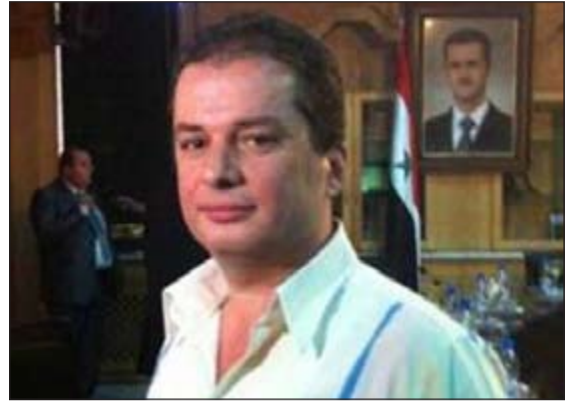
أول المتقدمين لطلب الترشح للرئاسة السورية النائب ماهر حجار

وتقضي الفقرة الثالثة من المادة الـ 85 من الدستور الذي تم الاستفتاء عليه في فبراير 2012 بأن «لا يقبل ماهر عبدالحفيظ حجار، ل يصبح بذلك أول المترشحين لمنصب رئيس الجمهورية في الانتخابات التي ستجري في 3 يونيو المقبل. وذكر الحجار في بث مباشر نقله التلفزيون الرسمي «ورد من المحكمة الدستورية استنادا لطلب من عضو مجلس الشعب ماهر عبدالحفيظ حجار من مواليد حلب عام 1968 أعلن فيه عن ترشيح نفسه لرئاسة الجمهورية العربية السورية مع الوثائق المرفقة له وقيد طلبه لدينا في السجل الخاص». وأضاف الحجار نقلا عن الطلب الذي تلقاه من رئيس المحكمة الدستورية أنه «استنادا لأحكام دستور الجمهورية العربية السورية وقانون المحكمة الدستورية العليا وقانون الانتخابات العامة نعلمكم عن واقعة ترشيح ماهر بن عبدالحفيظ حجار لمنصب رئاسة الجمهورية العربية السورية ليتسنى لأعضاء المجلس أخذ العلم بذلك وممارسة حقهم الدستوري فيما إذا رغبوا في تأييد المرشح المذكور».