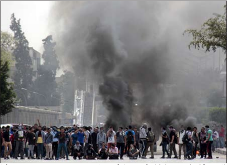
طلاب جماعة الإخوان يحرقون الإطارات بالقرب من جامعة القاهرة أمس

وفي السياق نفسه، قتل ضابط شرطة برتبة ملازم أول من أمس بطلق ناري في الرأس في تبادل إطلاق نار مع «عناصر إرهابية» مطلوبة خلال مدهمة مخبئهم بمدينة الإسكندرية الساحلية، شمال البلاد، حسبما أعلن المتحدث باسم الشرطة اللواء هاني عبداللطيف في كلمة بثها التلفزيون الرسمي. وقال المتحدث أن مسلحا قتل وأصيب آخران في الواقعة، وأضاف أنه جرى ضبط بنادق آلية وأحزمة ناسفة وقنابل يدوية، مضيفا أن «المتهمين من أخطر عناصر تنظيم أنصار بيت المقدس الإرهابي والتي كانت تخطط لاستهداف المنشآت الشرطة والعسكرية والقوات». وشارك رئيس الوزراء المصري إبراهيم محلب ووزير داخلية محمد إبراهيم في جنازة العميد القتل في مسجد الشرطة بالقاهرة.