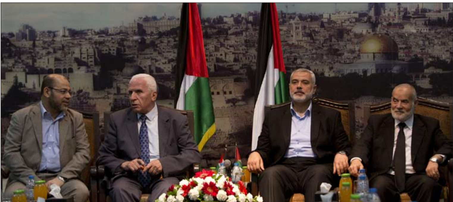
وفدا حماس برئاسة إسماعيل هنية وفتح برئاسة عزام الأحمدي في مؤتمر اعلان المصالحة في غزة أمس (أ.ف.ب)

عواصم - أ.ف.ب - رويترز: قال نشطاء حقوقيون لـ «رويترز» أن محكمة بحرينية أصدرت أحكاما أمس بالسجن المؤبد على 12 شخصا بعد أن أدانتهم بالتجسس وتلقي تدريبات عسكرية على أيدي الحرس الثوري الإيراني. وفي سياق متصل، نفت إيران أن يكون لها أي دور في الاضطرابات التي تشهدها مملكة البحرين، حسبا نقل وكالة الأنباء الإيرانية الرسمية عن مسؤول «مطلع» في وزارة الخارجية الإيرانية قوله أمس الأول. أعلنت وزارة الداخلية البحرينية أمس القبض