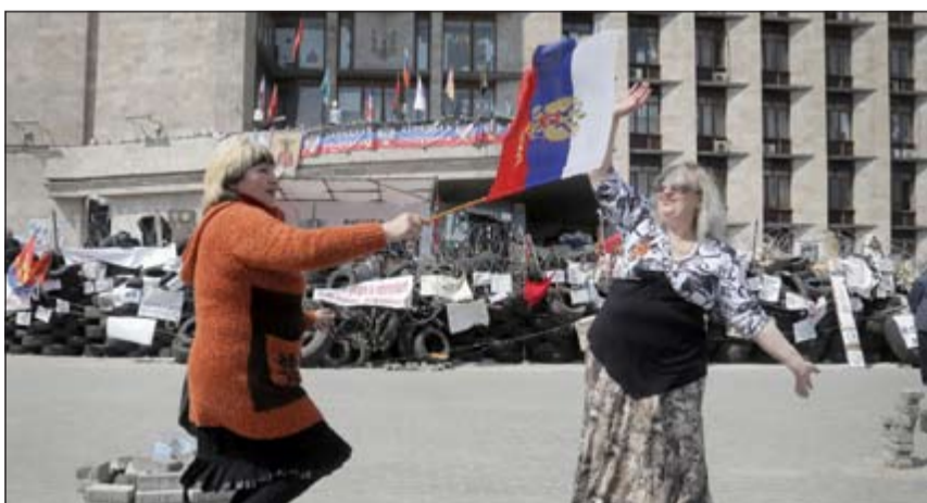
مولودين لروسيا يرفعون علمها وهم يؤدون حركات راقصة أمام مبنى الإدارة الإقليمية في دونيتسك

عواصم - أ.ف.ب - رويترز: قال نشطاء حقوقيون لـ «رويترز» أن محكمة بحرينية أصدرت أحكاما أمس بالسجن المؤبد على 12 شخصا بعد أن أدانتهم بالتجسس وتلقي تدريبات عسكرية على أيدي الحرس الثوري الإيراني. وفي سياق متصل، نفت إيران أن يكون لها أي دور في الاضطرابات التي تشهدها مملكة البحرين، حسبا نقل وكالة الأنباء الإيرانية الرسمية عن مسؤول «مطلع» في وزارة الخارجية الإيرانية قوله أمس الأول. أعلنت وزارة الداخلية البحرينية أمس القبض