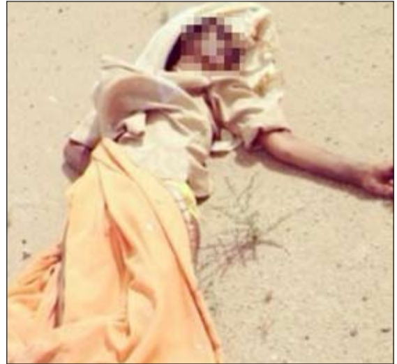
الجثة كما عثر عليها في منطقة الصديق

وأضافت أن الكفيل ادلى باعترافات كاملة عن تقديمه ببلاغ وهمي في نفس يوم تخلفه وزوجته من جثة الخادمة يفيد بتغييبها، لإبعاد الشبهة الجنائية وعدم تحمل المساءلة القانونية، كما اعترف بأنه هو وزوجته قاما بضرب