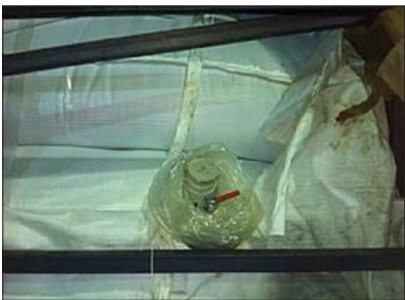
الديزل المسروق في الحاوية