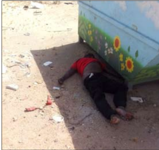
جثة الوافدة بجوار الحاوية

الخادمة وتعريضها لإصابات بليغة أدت إلى وفاتها، وقام على إثرها وزوجته بالتخلص من جثتها بالقائها بمنطقة الصديق حيث عثر عليها رجال المباحث الذين كثفوا جهودهم وانتشروا في عمليات بحث وتحري واسعة حتى تمكنت من ضبط القاتل وزوجته اللذين اعترفا بارتكاب الجريمة البشعة. هذا فيما تواصل سلطات التحقيق إجراءاتها لمعرفة المزيد من التفاصيل عن ظروف