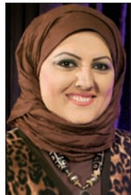
الإعلامية معصومة عبدالكريم

الصريحة والمميزة من كلتا النجمتين. يذكر أن الحلقة ستعرض في التاسعة مساء اليوم والإعادة يوم السبت المقبل في الساعة 4 عصرا.