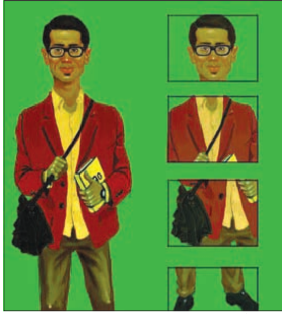
بوستر فيلم «090»

مختلفا تميز به بمسلسل «الواجهة» مع الفنانة القديرة سعاد عبدالله الذي عرض مؤخرا على شاشة «أم.بي.سي».