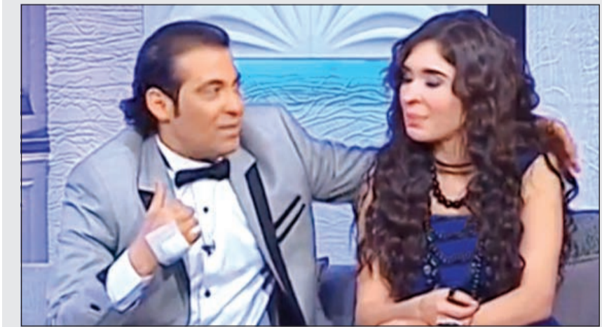
سعد الصغير ودينا في برنامج «أحلى مساء»

قال المطرب الشعبي سعد الصغير، إنه تربطه علاقة صداقة قوية بالفنانة دينا، مغربا عن سعادته بالتمثيل معها في أكثر من فيلم. وأضاف الصغير، في حوار له لبرنامج «أحلى مساء» على قناة «أم بي سي مصر»: «أنا بحب دينا جدا، ولن أنسى لها قبولها التمثيل معي» وتحرقش بها ووضع يده على كتفها، فقاطعت دينا قائلة: «طيب نزل ايدك من على كتفي.. أنا ست متزوجة». من جانبها، قالت الفنانة فيفي عبده، مقدمة البرنامج، «علاقتي بدينا جيدة، وهي بتسمع كلامي، وفيه بينا احترام»، فيما أوضحت دينا، أن فيفي عبده من من ساعدتها على الإنجاب، مضيفة: «أكبر مكسب في حياتي كانت فيفي سبب فيه». هذا وفاجأت فيفي المشاهدين بجلوسها على الأرض لتناول الفسيخ والرنجة في مناسبة الاحتفال بشم النسيم، وأعربت فيفي عن سعادتها بهذه الوجبة وجلست أرضا لتناولها متجاهلة الكاميرات في حين رفضت دينا أن تشاركها تناول هذه الوجبة واكتفت بالجلوس بجوارها.