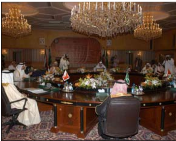
جانب من اجتماع الوكلاء المسؤولين عن الآثار والمتاحف بدول التعاون