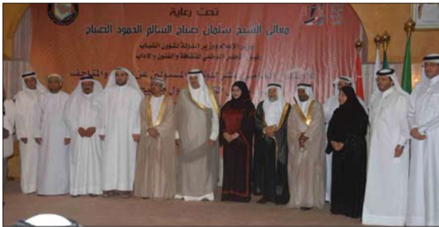
الشيخ سلمان الحمود مع عدد من المكرمين