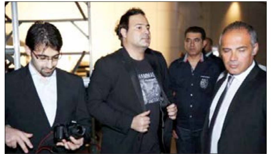
عاصي الحلاني في أبو ظبي

في الحفل الذي أقامه فندق «فايسروي ياس» في أبو ظبي وسط طقس حار جدا، غنى فارس الأغنية العربية عاصي الحلاني، حيث أقيم الحفل في حديقة الفندق، وكان من المفترض أن يبدأ الحفل في تمام الساعة الثامنة والنصف لكنه بدأ بعد ساعتين من الموعد المحدد، بينما بدأ الجمهور الحفل قبل صعود عاصي على المسرح، حيث كان هناك «DJ» يلعب موسيقى والأغاني العربية والغربية، فشارك الحضور رقصا وتهللا وانفعا مع الأغاني.