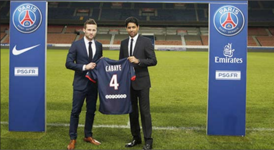
انتقال كاباي إلى سان جيرمان قد يحرمه المشاركة في المونديال

وجه ديبدي ديشامب المدير الفني لمنتخب فرنسا رسالة طمأنة إلى يوهان كاباي لاعب وسط فريق باريس سان جيرمان الفرنسي وذلك قبل مونديال البرازيل.