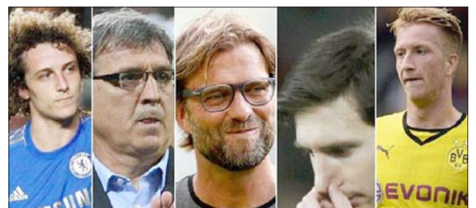
من سياتي ومن سيغارد

بمدر بوروسيا دورتموند يورغن كلوب، غير أن المعلومات الواقعية تشير إلى أن الأقرب للمنصب هما إرنستو فالفيردي مدرب اتلتيك بلباو ولويس إرنكي مدرب سلتا فيغو. وبالعودة لمسألة الصفقات، فقد خصص برشلونة 100 مليون يورو لشراء لاعبين في حال الغيت عقوبة الفيفا، وعلى رأسهم الألماني ماركو رويس نجم دورتموند، بجانب مواطنه تير شتيغن حارس مونشنغلادباخ، والكولومبي كوارادو جناح فيورنتينا، والبرازيلي ديفيد لوين مدافع تشلسي والفرنسي مانغالا مدافع بورتو، والحارس الإسباني بيبي رينا لاعب نابولي الإيطالي، ولاستيعاب الصفقات الجديدة سيجب على «البلوغرانا» الاستغناء عن لاعبين كثر، ولم يبد مانغا في ترحيل 13 لاعبا، من المؤكد أن من بينهم الحارس فيكتور فالديس والقائد كارلوس بويول والمهاجم التشيلي سانتشيز، والظهيرين البرازيليين داني ألفيس وأدريانو، والأرجنتينيين ماسكيانو.