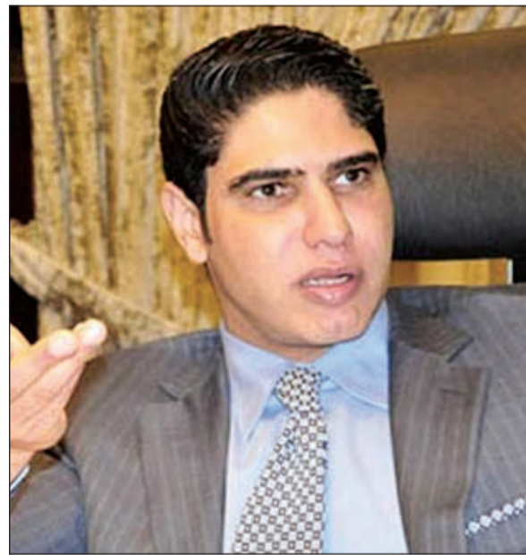
أحمد أبو هشيمة

السبب في إصداره قرار منع فيلم «حلاوة روح»، وقال أبو هشيمة في بيان إعلامي صدر عن مكتبه إن كل ما نشر على المواقع ما هو إلا نسج من خيال صاحبها أو من دفع له ليكتب ما كتب. وأضاف بيان أبو هشيمة: «طالعنا أحد المواقع الإخبارية اللبنانية بقصة «ساذجة» لم يقتصر نشرها على هذا الموقع «المبتدئ»، بل تم ترويجها إلى العديد من المواقع حول تدخل