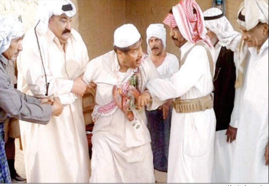
..وفي مسلسل «المعرب»