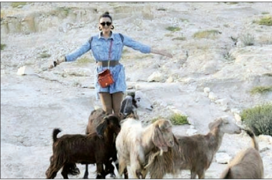
هيفاء حسين في مشهد من السلسل

مسلسل البطران تأليف جاسم الخراز واخراج عبداللطيف الصحاف، وتدور أحداثه حول ابن بعيش مع والده الغني الذي يتوفي بعدها ويكتشف أن لديه مجموعة من الاخوة والأخوات لأن والده كان مزواجا، وتتفرع الاحداث من هذه القضية، حيث يبرز صراع كوميدي بين الاخوة وبعد مرور الوقت يضطرون للتلاحم فيما بينهم.