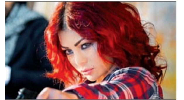
هيفاء بالقميص نفسه

يبدو أن موضة قميص الكاروهات مستمرة لعام 2014 وخاصة في فصل الربيع لأنه من أكثر القطع المناسبة لفصل الربيع، ورصدت مؤخرا المغنية المثيرة للجدل ليدي غاغا في الموضة ترتدي هذا القميص، لكن لم تكن غاغا أول أو آخر من ارتدى هذا القميص، فالقائمة طويلة بأسماء المشاهير، كالمغنية ما يلي سايروس وريهان وكاتي بيري وغيرهن.