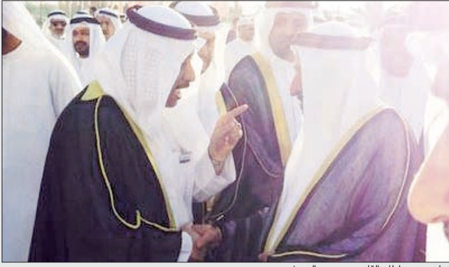
حوار بين د.سلطان القاسمي وديبر الدويش

التوفيق لجميع المشاركين من أعضاء وفد الكويت بتقديم ما يليق بالتراث الكويتي والمساهمة في إيصال صورة واضحة عن الموروث لدى الكويت والذي يعد جزءاً أصيلاً من تراث أمنا العربية والإسلامية، مشيداً بالأجواء التي تسود فعاليات مهرجان أيام الشارقة التراثية، متمنياً للشارقة حاكماً وشعباً المزيد من التقدم والازدهار. واختتم تصريحه قائلاً: إن عاصمة الثقافة الإسلامية إمارة الشارقة ومن خلال الأيام التراثية تؤكد بانها خيمة التراث والثقافة في ظل رعاية ودعم عضو المجلس الأعلى لدولة الإمارات العربية المتحدة حاكم الشارقة سمو الشيخ د. سلطان بن محمد القاسمي.