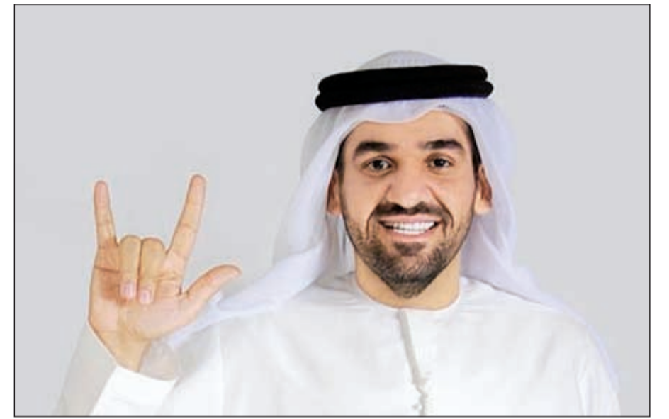
حسين الجسمي ولغة الإشارة

استمررا لمواقفه الإنسانية الداعمة لأعمال الخير، قام المطرب الإماراتي حسين الجسمي بنشر صورة له على صفحته بتويترو وهو يستخدم علامة الإشارة تعبيراً عن حبه لمرضى الصم والبكم. الجسمي علق على الصورة قائلاً: بلغة الإشارة..