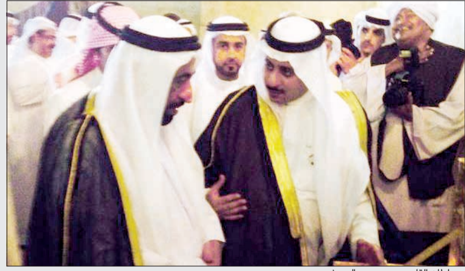
د.سلطان القاسمي مع د.ديبر الدويش

أشاد الأمين العام المساعد لقطاع الثقافة والفنون في المجلس الوطني للثقافة والفنون والآداب ورئيس الوفد الكويتي المشارك بالدورة الثانية عشرة لأنشطة مهرجان أيام الشارقة التراثية د.ديبر فيصل الدويش والتي تتواصل أعمالها هذه الأيام في الشارقة في دولة الإمارات العربية المتحدة الشقيقة. تحت شعار «التراث الإسلامي خيمة واحدة» والتي تستمر حتى 25 الجاري، ضمن احتفالات إمارة الشارقة عاصمة الثقافة الإسلامية 2014م ووجه الدويش في تصريح خاص شكره وتقديره وامتنانه إلى الشيخ د.سلطان القاسمي عضو المجلس الأعلى حاكم إمارة الشارقة لتفضله برعاية وحضور هذه الأيام التراثية