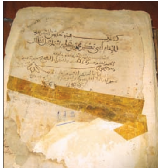
إحدى المخطوطات النفيسة بالزاوية الحمزية

نعمل على تسهيل رجوع الطلبة والباحثين والعلماء للخزانة الوطنية بالرباط