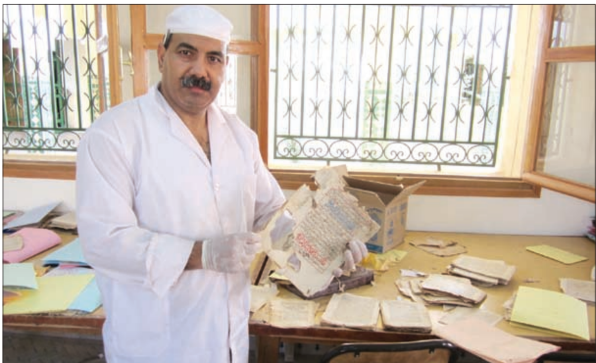
.. وخلال متابعتها إحدى المخطوطات