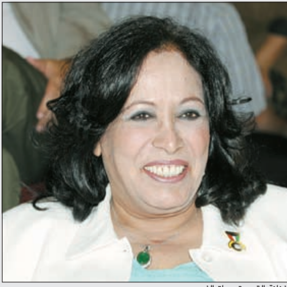
الفنانة القديرة حياة الفهد