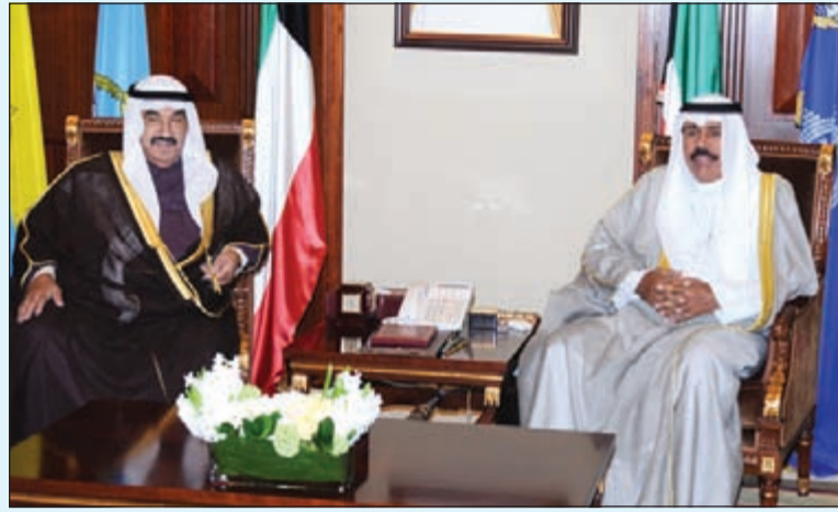
سمو ولي العهد الشيخ نواف الأحمد مستقبلاً سمو الشيخ ناصر المحمد