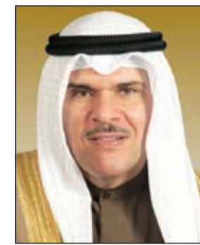
الشيخ سلمان الحمود

بحث وزير الإعلام ووزير الدولة لشؤون الشباب الشيخ سلمان الحمود مع وفد من «دار الصياد اللبنانية» عدداً من القضايا الراهنة من منظور إعلامي وصحافي. وقال بيان صحافي لوزارة الإعلام امس ان الحمود ناقش خلال استقبله الوفد الذي ضم كلا من سامي زهر الدين ومارلين أبوزيد والهيام نجم مجمل التطورات الإقليمية