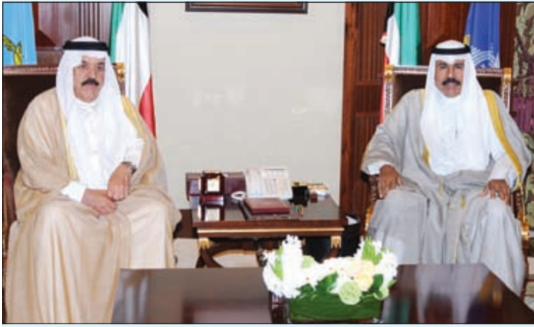
سمو ولي العهد الشيخ نواف الأحمد خلال استقبله الفريق متقاعد عبدالله الفارس