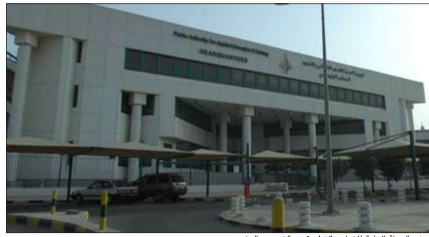
مبنى الهيئة العامة للتعليم التطبيقي والتدريب الرئيسي

وخلص خطاب الهيئة إلى أن هذا التوجه إيجابي وسيجعل أعضاء هيئة التدريس والتدريب منفرغين لمهامهم التدريسية في الكليات والمعاهد، والمساهمة في فتح شعب دراسية إضافية للطلبة في مختلف الكليات والمعاهد.