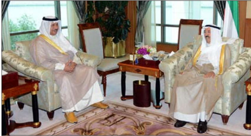
صاحب السمو الأمير الشيخ صباح الأحمد مستقبلاً سمو رئيس مجلس الوزراء الشيخ جابر المبارك

وأوضح الشيخ سلمان أن الكويت في ظل قيادتها الحكيمة تؤكد دائماً على استمرارية مواقفها الإنسانية تجاه شعوب العالم، وذلك لإيمانها بميثاق الأمم المتحدة واعتبارها حجر أساس في مفهوم العمل الجماعي في حفظ الأمن والسلم الدوليين.