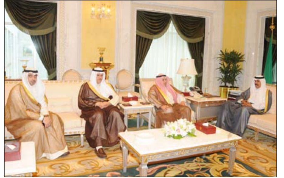
سمو ولي العهد الشيخ نواف الأحمد مستقبلاً الشيخ خالد الجراح والشيخ سلمان الحمد والشيخ محمد العبدالله

استقبل سمو ولي العهد الشيخ نواف الأحمد في ديوانه بقصر السيف صباح امس رئيس مجلس الأمة مرزوق الغانم. واستقبل سموه بقصر السيف صباح امس سمو رئيس مجلس الوزراء الشيخ جابر المبارك. واستقبل سمو ولي العهد بقصر السيف صباح امس النائب الأول لرئيس مجلس الوزراء وزير الخارجية الشيخ صباح الخالد.