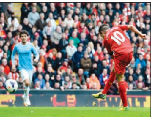
تسديدة البرازيلي كوتينييو في طريقها لهدف شباك مان سيتي

الريز «نار على نار» ويواصل المشوار لحصد لقب «البريميرليغ»