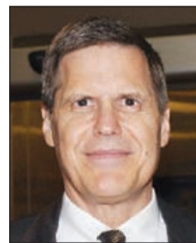
السفير الأميركي ماثيو تولر

الحوار المتواصل حول سيل منع هذا من الاستمرار». وأعرب تولر عن دعم بلاده لخارطة الطريق في مصر، لافتاً إلى أن الولايات المتحدة، بالتعاون مع عدد من الدول الصديقة لمصر، تحاول مساعدة مصر على إنجاز هذا الانتقال بشكل سلس، حيث ستكون اختيارات الشعب المصري هي تلك التي نختارها للمساعدة. وبخصوص الأزمة مع روسيا حول الأوضاع في