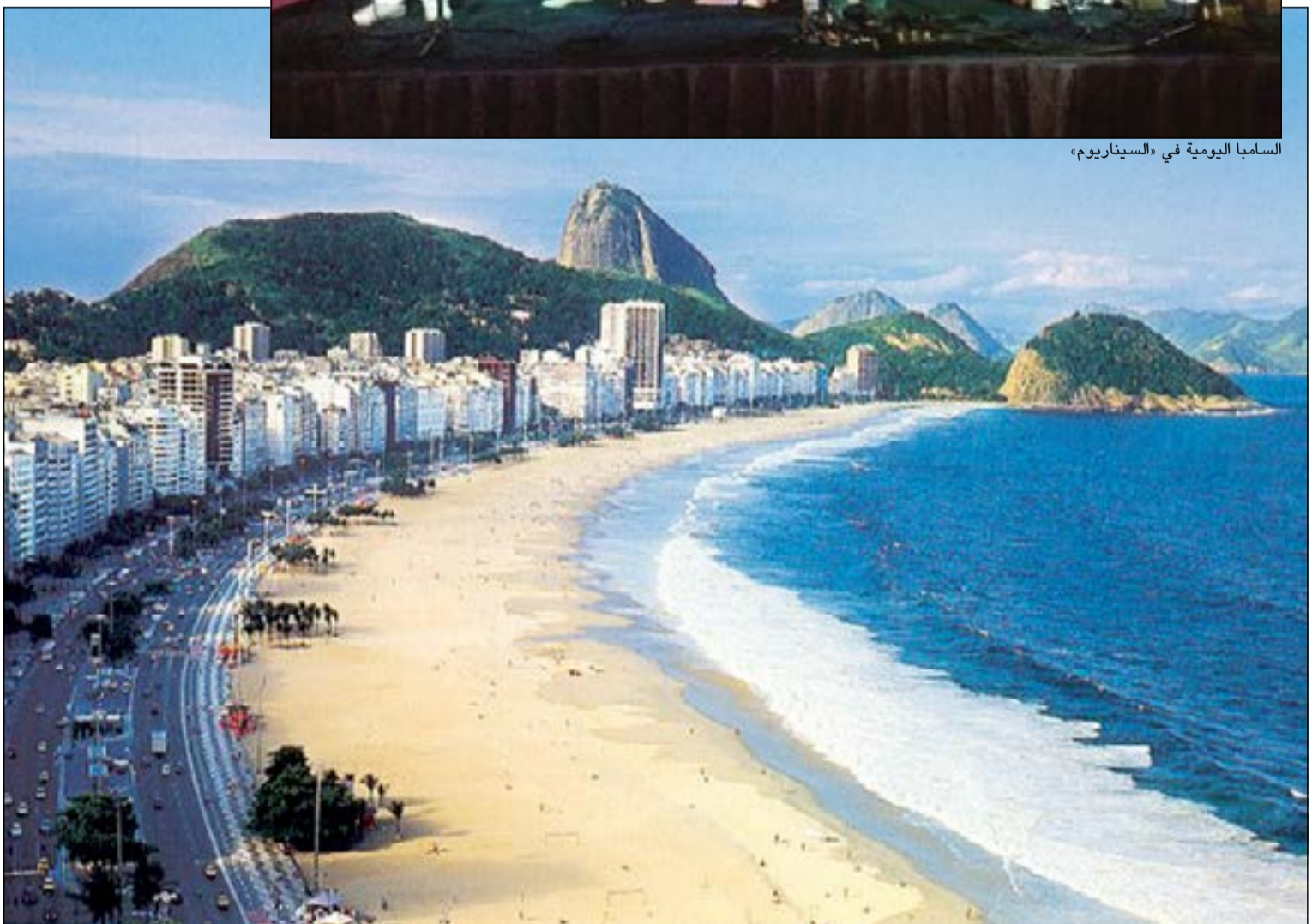
شاطئ الكوبا كابانا الشهير