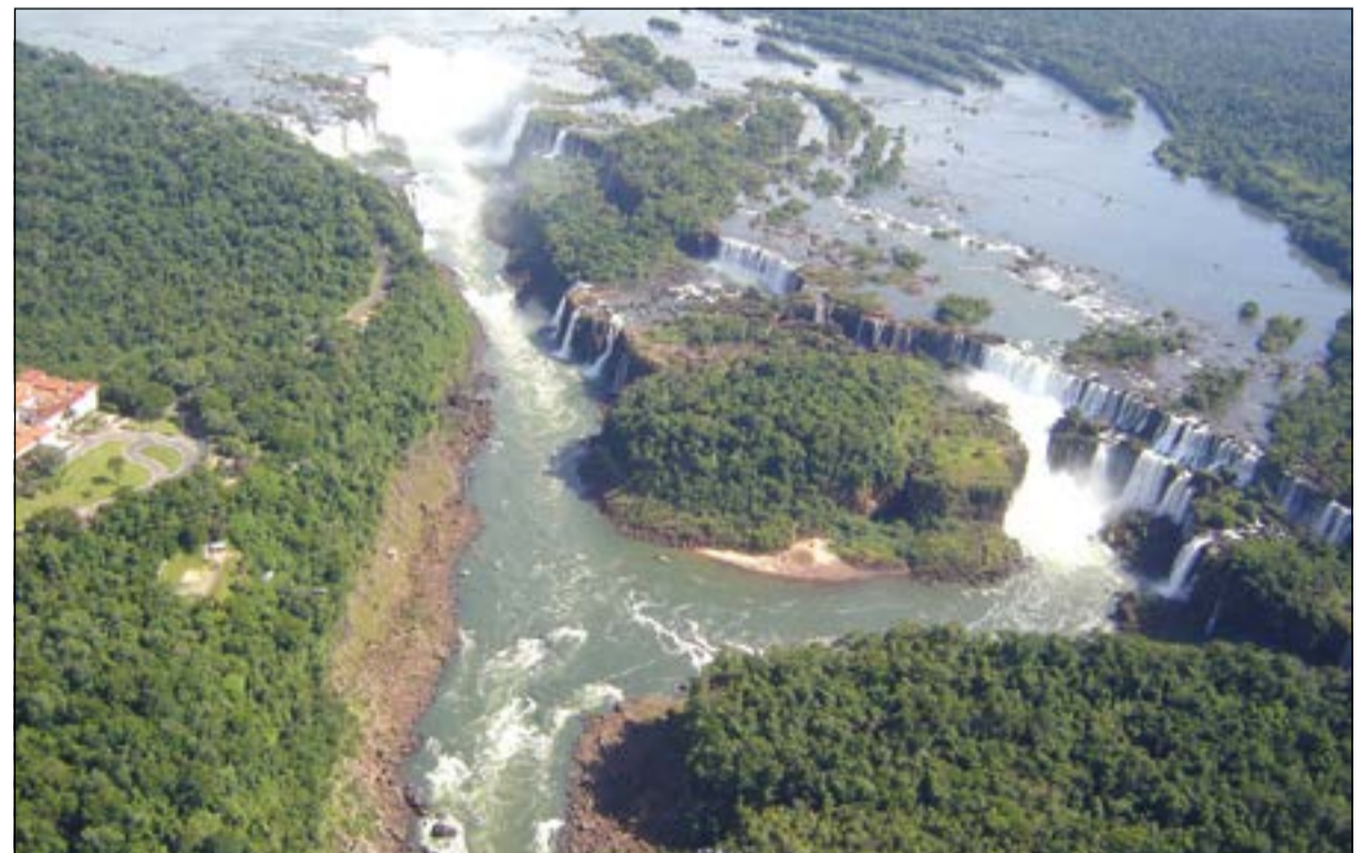
صورة لشلالات ايغواسو إحدى عجائب الدنيا السبع