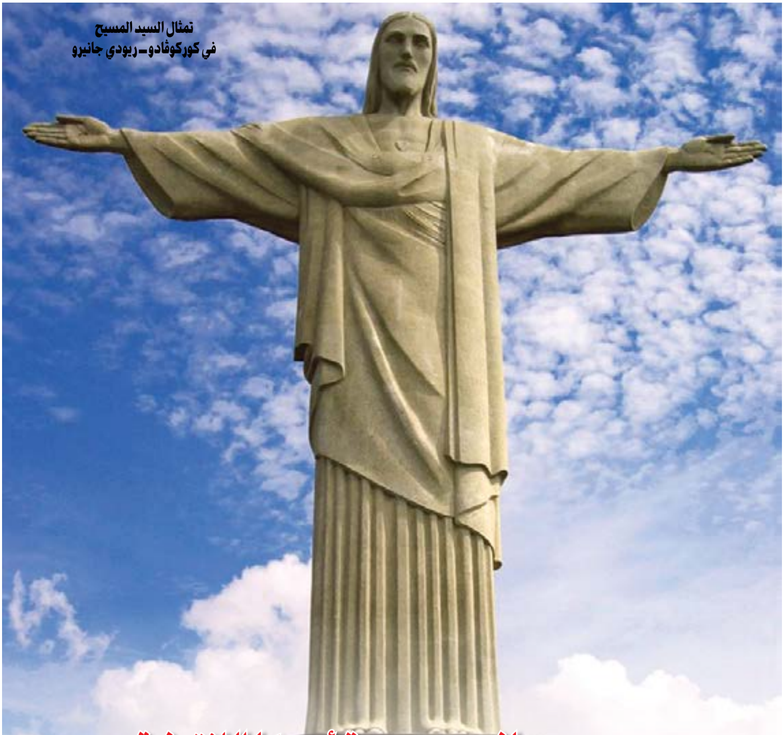
تمثال السيد المسيح في كوركوفا دو ريو دي جانيرو

فندق ذو بناء عمودي يقع بعد 300 متر من نشاطاً كوبا كابانا لجهة نشاطاً ليمي وقريب من المطار وستاد ماراكانا وتل شوغر لوف الشهير. غرفه مريحة ومطاعمه مميزة.