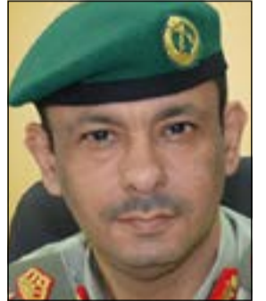
العميد محمد الفرحان

أكدت وزارة الداخلية ما انفردت بنشره «الأنباء» يوم أمس بشأن ضبط ضابط وضابط صف للاتجار في السلاح، وقال بيان صادر عن إدارة العلاقات العامة: تمكنت فرقة ضبط الأسلحة والذخائر التابعة للإدارة العامة للمباحث الجنائية