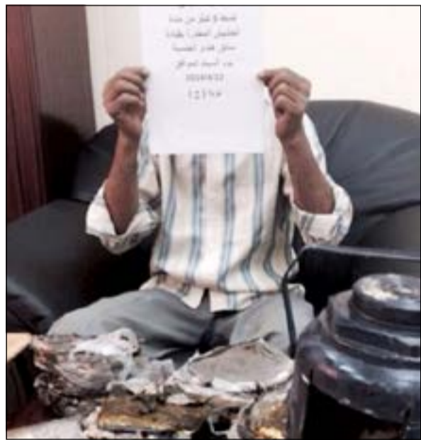
الوافد وأمامه المضيوطات

واشار المصدر الى ان رجال المكافحة حاولوا الاتصال على الهاتف وتبين انه مغلق وجار التواصل مع شركات