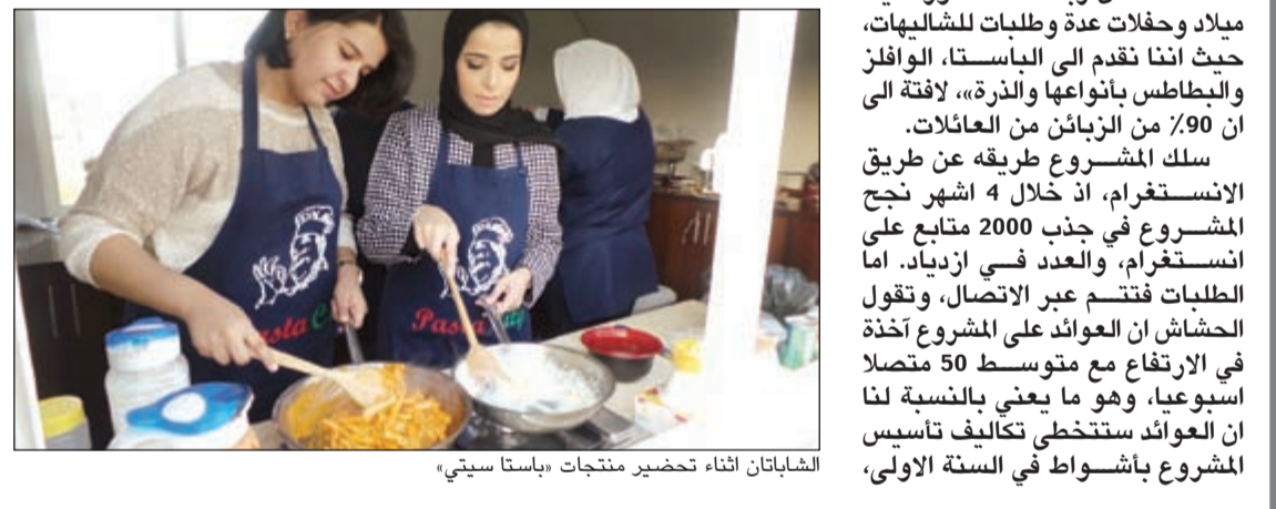
الشابتان أثناء تحضير منتجات 'باستا سيتي'