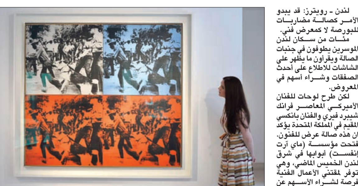
زائرة أمام لوحة لفنان أميركي معروضة بـ 50 مليون دولار في صالة كريستي للمزادات وسط لندن أمس (رويترز)

لندن - رويترز: قد يبدو الأمر كصالة مضاربات للبورصة لا كعرض فني. مئات من سكان لندن الموسرين يطوفون في جنبات الصالة ويقرون ما يظهر على الشاشات للاطلاع على أحدث الصفقات وشراء أسهم في المعارض. لكن طرح لوحات للفنان الأميركي المعاصر فرانك شبيرد فبري والفنان بانكسي المقيم في المملكة المتحدة يؤكد أن هذه صالة عرض للفنون. فتحت مؤسسة (ماي آرت إنفست) أبوابها في شرق لندن الخميس الماضي، وهي توفر لمقتني الأعمال الفنية فرصة لشراء الأسهم عن طريق الإنترنت في أعمال لفنانين مشهورين يرسمون جداريات في الشوارع، وقد يتدنّى سعر السهم إلى 5 جنيهات استرلينية فقط (8 دولارات). وقال توم -ديفيد باستوك، المؤسس الفرنسي لماي آرت إنفست، ويبلغ من العمر 25 عاما - «رويترز»: «نريد أن ننضف طابعاً ديموقراطياً على الفن. بالنسبة لي من المهم جدا أن يكون لكل شخص موضع قدم في سوق