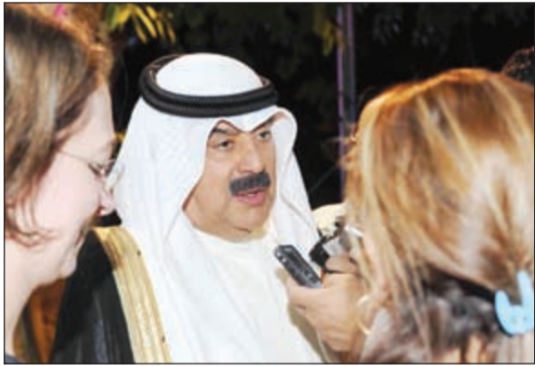
خالد الجارالله يتحدث للصحافيين حول اختطاف مواطنين في سورية

الجار الله يؤكد خبر «الأنباء»: «الخارجية» تبذل جهوداً حثيثة عبر وسيط تركي للإفراج عن مواطنينا المختطفين في سورية