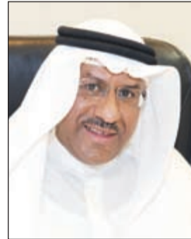
المستشار ضرار العسوس

أكد وكيل وزارة الخارجية خالد الجارالله ما انفردت به «الأنباء» من اختطاف 3 مواطنين كويتيين في سورية، مشدداً على أن وزارة الخارجية تتابع هذا الأمر باهتمام بالغ، على الرغم من عدم وجود معلومات كافية حول هذا الأمر، إلا أن هناك جهوداً حثيثة تبذل عن طريق وسيط تركي حتى يتم الإفراج عنهم في القريب العاجل.