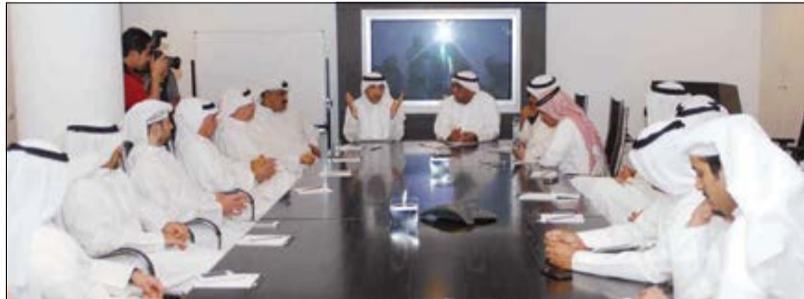
جلسة حضرتها «الأنباء» جمعت أكثر من 20 بورصويا

يلعب في موبايه أغلب الوقت، ويجيب: «المضارب يعيش في الأسمه الرخيصة لأنها مريحة وتحديث عاندا سريعا لا يمكن لسهم ثقيل أن يقبله، أما إذا قال لك غير ذلك فهو للتعميه لا أكثر»، يشير إلى موبايه حيث أنشأ «جروب» على «واتساب» مع مجموعة من المضاربين، ثم يقول: في مثل هذه الجروبات تعدد يومية اجتماعاتنا لعرف ماذا نشترى وماذا نبيع؟ نسأله من يجتمع في هذه الجروبات، هل هم منداولون عاديون أم هناك مسؤولون في شركات؟ يجيب بلا تردد: هناك أشخاص من داخل شركات يسربون لنا أخبارا خاصة، وهناك أيضا مسؤولون في جروبات أخرى، فهؤلاء مصادر التحريك الرئيسية للأخبار في السوق، وغالبا ما يأتي الخبر عن طريقهم، فيعود لسؤاله مرة أخرى ألم تمنع هيئة أسواق المال هؤلاء من التداول على أسهمهم؟ فيجيب ضاحكا: «هذا صحيح، ألا ترى كل هذه الضجة الإعلامية لتعديل قانون هيئة أسواق المال، الكل يريد العودة إلى السابق، إلى زمن اللعب، فهذا