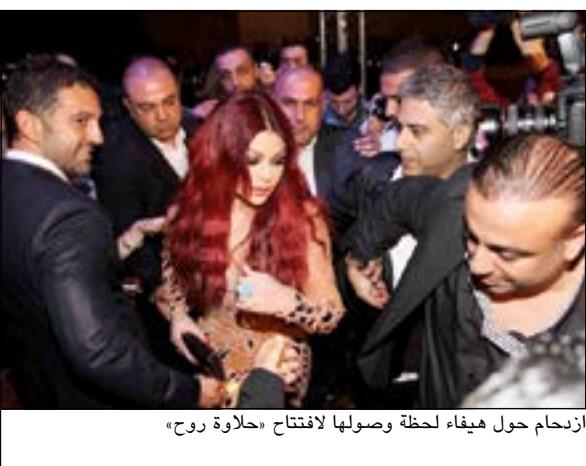
ازدحام حول ميفاء لحظة وصولها لافتتاح «حلاوة روح»