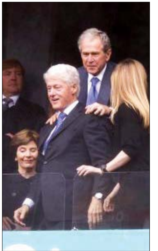
الرئيسان بوش وكلينتون يحضران المباراة