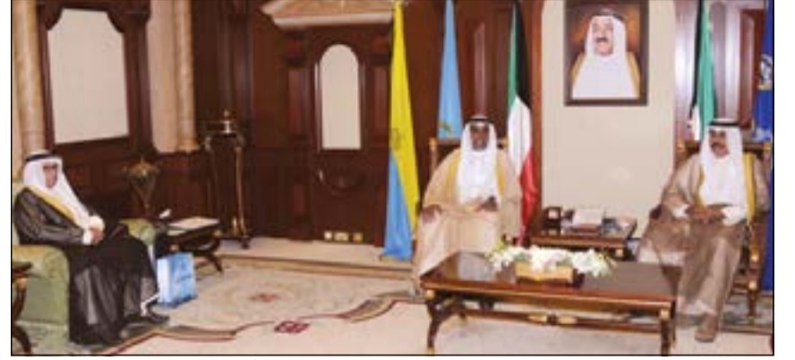
سمو ولي العهد الشيخ نواف الأحمد مستقبلاً المستشار عبدالرحمن النمش وأحمد الريمحي

انتهاء مهام عمله سفيراً للبلاد، حضر المقابلة وكيل ديوان سمو ولي العهد للشؤون الإعلامية الشيخ مبارك الحمود ووكيل ديوان سمو ولي العهد لشؤون المراسم والتشريفات، الشيخ مبارك صباح السالم. الهيئة العامة لمكافحة الفساد أحمد الريمحي وذلك بمناسبة تعيينه في منصبه الجديد. كما استقبال سمو ولي العهد الشيخ نواف الأحمد، بقصر بيان ظهر أمس سفير جمهورية كوريا الجنوبية لدى الكويت كيم كيونج سيك وذلك بمناسبة