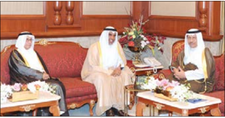
سمو الشيخ جابر المبارك مستقبلاً المستشار عبدالرحمن النمش وأحمد الريمحي

استقبل رئيس مجلس الوزراء سمو الشيخ جابر المبارك في قصر بيان أمس رئيس الهيئة العامة لمكافحة الفساد، حيث قدم لسموه أحمد الريمحي وذلك بمناسبة تعيينه أميناً عاماً للهيئة العامة لمكافحة الفساد.