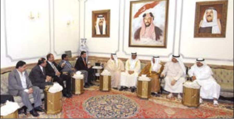
سمو الشيخ ناصر المحمد مستقبلاً أحمد الصفي والوفد المرافق بحضور مبارك الخرينج

استقبل سمو الشيخ ناصر المحمد وبحضور رئيس مجلس الأمة بالإنيابة، مبارك الخرينج، استقبال سموه النائب الأول لرئيس مجلس النواب في المملكة الأردنية الهاشمية الشقيقة أحمد الصفي والوفد المرافق، بمناسبة زيارته إلى البلاد.