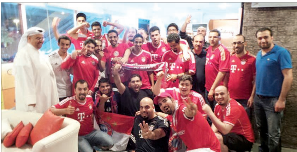
تتبعكم يا مان يونايتد، لسان حال أعضاء رابطة بايرن