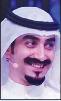
الشاعر عبدالله الهدال