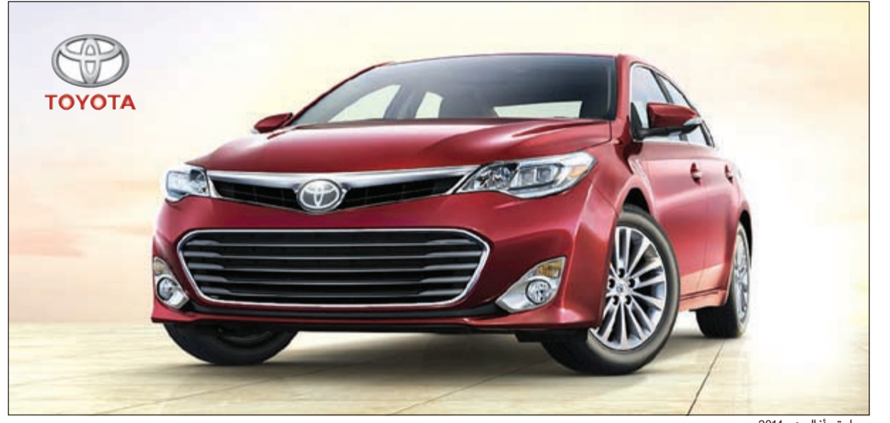
سيارة «أفالون» 2014