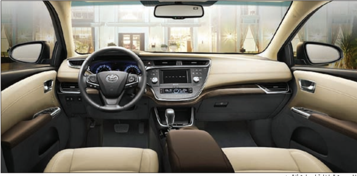
المقصورة الداخلية لسيارة أفالون