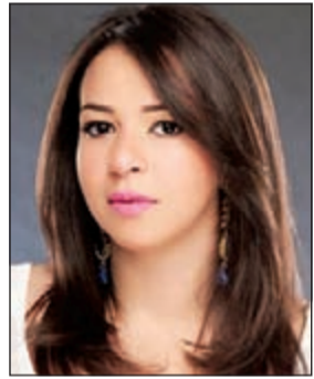
إيمي سمير غانم