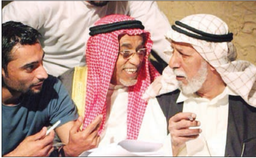
العامر والصلال في «المعزب»