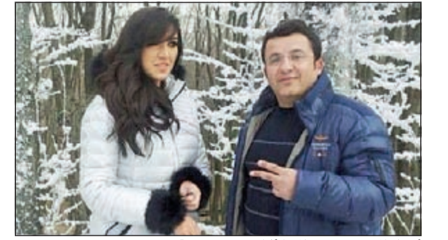
أسماء المنور ويعقوب المهنا أثناء تصوير «دمعة رجل»

اختارت المطربة المغربية أسماء المنور أن تروي قصة أحدث أغنياتها المنفردة «دمعة رجل» أمام كاميرا المخرج