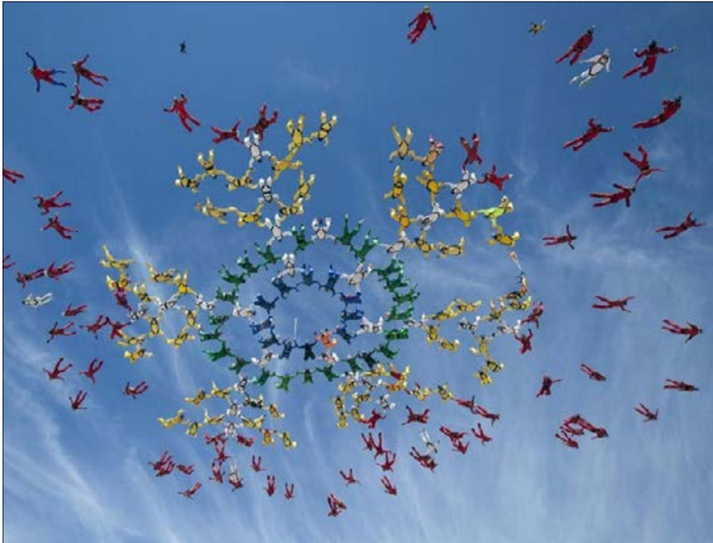
المتنافسون على تحقيق رقم قياسي جديد أثناء التحليق

وأشارت إلى أن الطائرة المستخدمة في المحاولة عملت بشكل طبيعي وأن الأحوال الجوية كانت مواتية وقت وقوع الحادث في الساعة 7:30 صباحاً بالتوقيت المحلي.