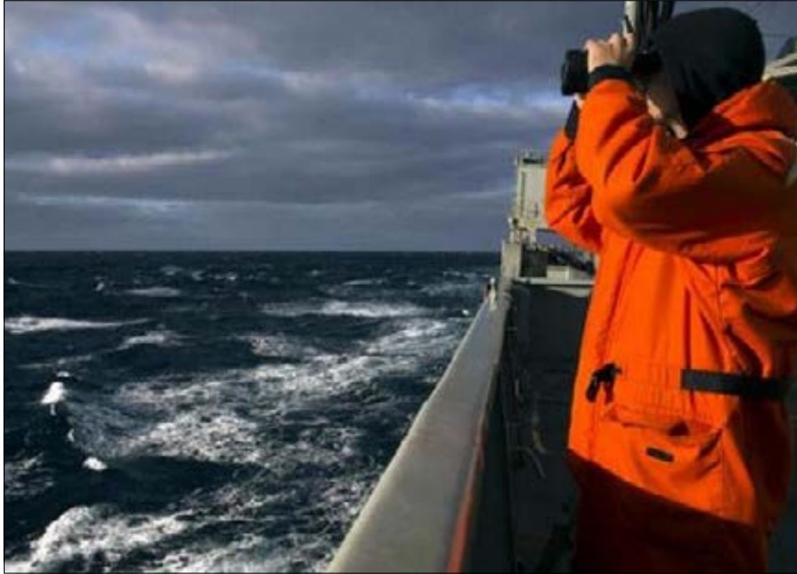
ولايزال البحث جارياً عن «الماليزية»

سيدني - رويترز: انتقل البحث عن الطائرة الماليزية المفقودة في المناطق النائية قبالة سواحل أستراليا إلى أعماق البحار للمرة الأولى الجمعة، باستخدام جهاز متطور للبحرية الأميركية، لتحديد موقع الصندوق الأسود مع اقتراب انتهاء عمر بطارية مسجل بيانات قمر القيادة.