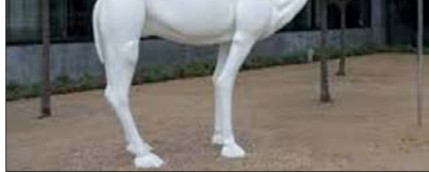
الجمل الذي اثار مشكلة

واشنطن - إيلاف: أثار خطة وزارة الخارجية الأميركية وضع تمثال جمل، دفعته 400 ألف دولار لشراؤه، داخل سفارتها في إسلام آباد، أثار مشكلة بين البلدين، فيما اتهم باكستانيون الحكومة الأميركية بأنها تجهل ثقافة وتراث بلدهم وأنها لا تفرق بين الباكستانيين والعرب. ابتاعت وزارة الخارجية الأميركية تمثال الجمل، الذي صنعه الفنان جون بولديساري من الألباف الزجاجية، وسمى عمله: «جمل يتأمل في إبرة»، في إطار مشروع رصد له مليار دولار، من أجل تجديد السفارة الأميركية في إسلام