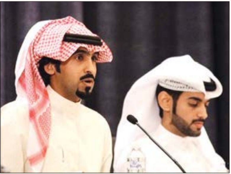
جانبا من الأمسية

انتي المزيونة المزيونة اللي كل ما مرت علي اقول لبا البشاشة والحجاج المسفهي والجمال الواضح اللي ما يغبا وينض آخر جفت سواقي غلاك وطاحت اشجارك واضيمتني من وفاك وبيست غصوني باليقتي مت قبل اعيش في نارك وبالينتي سرت في حبك على هوني حببت غيري حبيبي جعله مبارك كانك تهينت كان (الله في عوني) حاولت أكذب عيونتي وأقبل أعذارك حاولت لكن شسوي عيت عيونتي