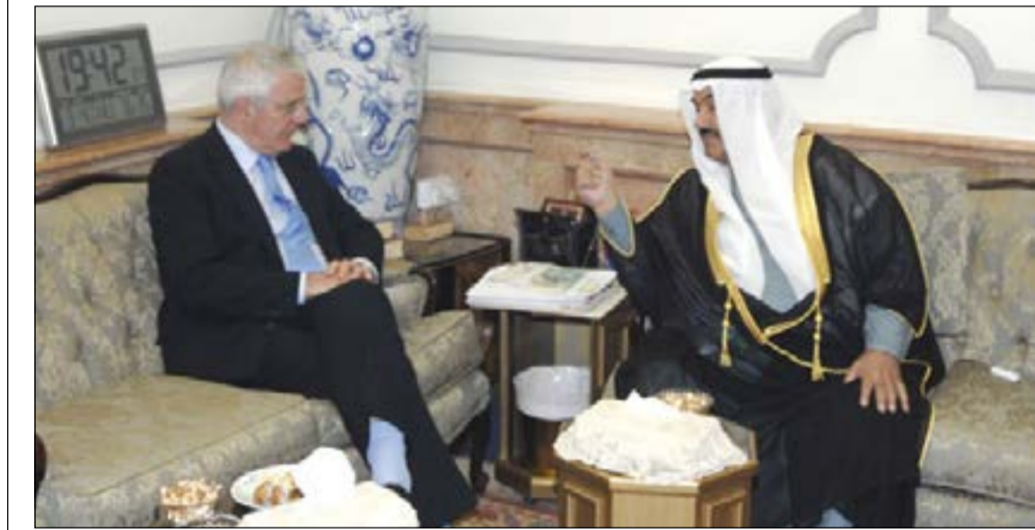
سمو الشيخ ناصر المحمد في حديث مع جون ميجور