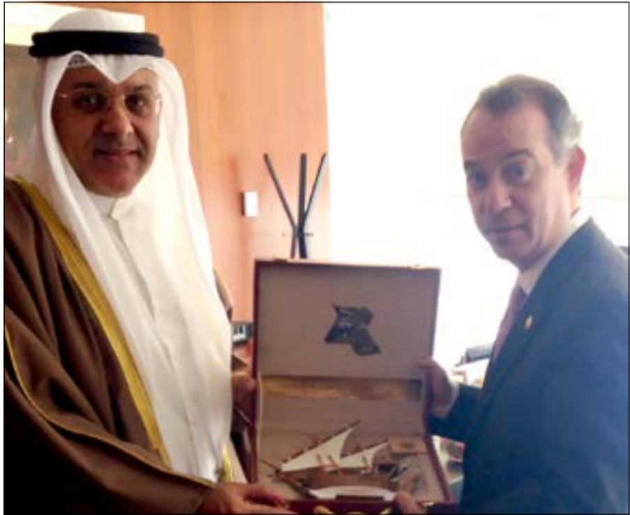
السفير سميح جوهر مع السيناتور د. راؤول سارفاتاس أندراد

مقر مجلس الشيوخ وسط العاصمة مكسيكو سيتي. وأشار السفير حيات إلى أن الهدف المنشود هو التعاون والتنسيق على الصعيد الثنائي وفي المحافل الدولية بين مجلس الأمة الكويتي ومجلس الشيوخ المكسيكي عن طريق تفعيل أعمال لجنة الصداقة البرلمانية المشتركة بين البلدين.