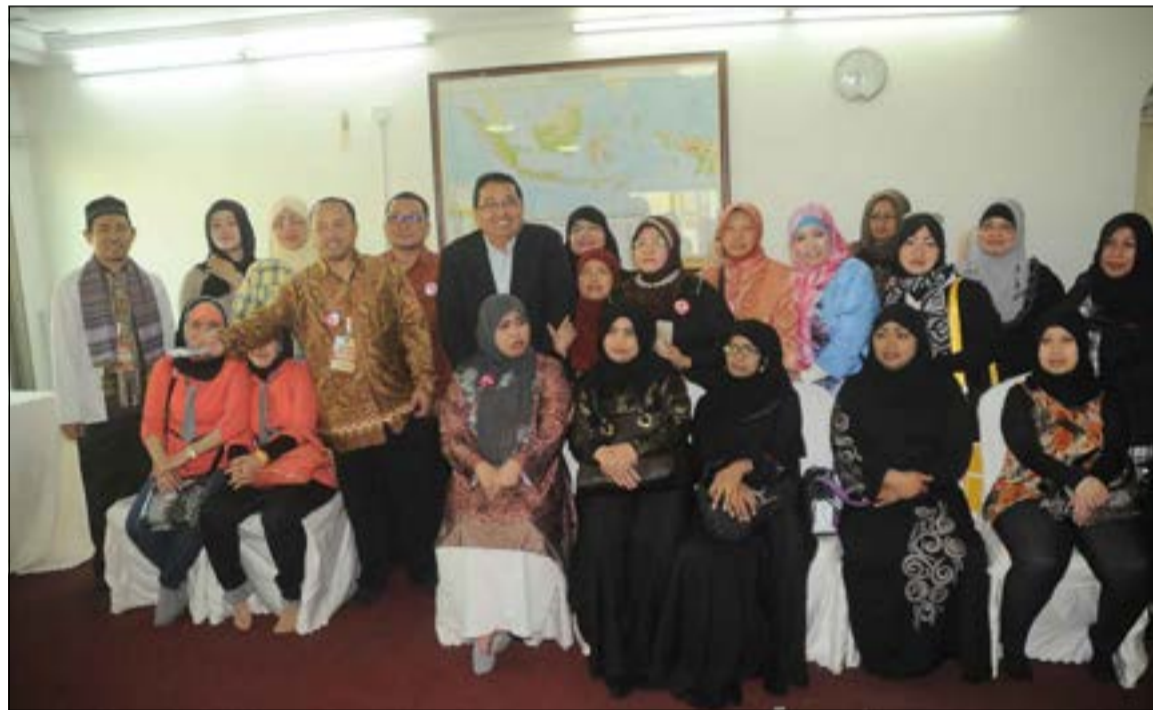
السفير قيري أدمهار وعدد من أبناء الجالية الإندونيسية (إسامة أبو عطية)