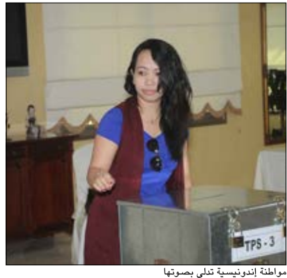
مواطنة إندونيسية تدلي بصوتها

ينتخبون من يرونه مناسبة وأن التغيير إن حدث فسيكون عبر اقتراع الجاليات في الخارج ومنها الكويت، والذين هم من سيقرون من سيمثلهم في البرلمان سواء من مجموعات أو أشخاص ميبنا وجود هيئة عامة للانتخابات تشرف على الاقتراع في الكويت والخارج وليس السفارة التي تعتبر جزءا محايدا. وأبدى سعادته لدى المشاركة التي شهدتها الانتخابات الحالية، لافتا إلى وجود ثمانية صناديق للاقتراع مخصصة حسب المناطق الكويتية إضافة إلى وجود صندوق اقتراع متنقل لمن لا يستطيع الحضور لأسباب قاهرة كالتواجد في المستشفى. وبين أن اندونيسيا ستشهد بعد فترة من الزمن انتخابات رئاسة الجمهورية والتي سيتمخض عنها انتخاب وجه جديد لأن