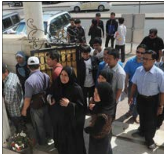
إقبال على التصويت من أبناء الجالية