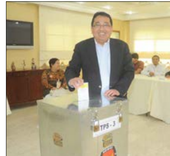
السفير أدمهار يدللي بصوته

إدارة الانتخابات، ولافتا إلى إمكانية أبناء الحالية غير المسجلين المشاركة في الانتخابات من خلال إحضار أوراق ثبوتية كجواز السفر أو البطاقة المدنية. وبالنسبة للنتائج فإشار إلى أنه سيتم فرز الأصوات في الكويت وبعدها سيتم إرسال النتائج مع صناديق الاقتراع إلى جاكارتا ليتم جمعها مع أصوات مواطني بلاده في الخارج. وأشار بالتزام أبناء الجالية في الاقتراع والإدلاء بأصواتهم، موضحا أنه سيتم اختيار 7 أعضاء لتمثيل إندونيسيا في الخارج، ومبيننا وجود اثنتي عشرة لائحة في كل منها سبع مرشحين، لافتا إلى وجود المرأة في جميع اللوائح باعتبار أن القانون الإندونيسي يكفل للمرأة حق الاقتراع والترشح ويعطينا كوتا بنسبة 30٪ للتمثيل في البرلمان.