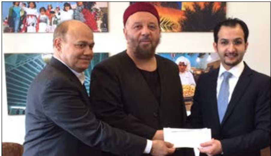
ممثل سفارتنا لدى كندا يسلم التبرع إلى إدارة المركز الإسلامي في مدينة «اكليوت» في منطقة «نونافنت» الكندية

الخيري وخدمة الإسلام والمسلمين في شتى بقاع العالم. يذكر أن مدينة «اكليوت» تقع في أقصى الشمال الكندي بالقرب من القطب الشمالي والذي يمتاز ببرودة الطقس الشديدة حيث أن أعداد المسلمين فيها تتزايد بصورة متسارعة في السنوات الأخيرة. ويعد هذا أول مسجد سيقام في تلك المدينة بل سيكون المسجد الوحيد في منطقة نونافنت التي تزيد مساحتها على مساحة أوروبا الغربية.