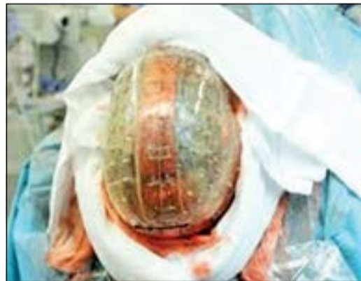
جمجمة ثلاثية الأبعاد

عند زرع الجزء العلوي من الجمجمة، تمت الاستعاضة عن العظام الحقيقية بأخرى من البلاستيك التي طُبعت بواسطة طابعة ثلاثية الأبعاد. ووفقاً لممثلي جامعة أوترخت، فإن هذه هي أول حالة زراعة لجمجمة في العالم لم يرفضها الجسم.