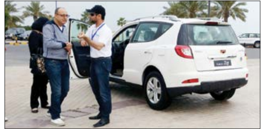
تجربة سيارة «جيلي»

عرض الضمان مدى الحياة وخدمة مجانية لسنة كاملة. وتتمتع سيارات «جيلي» بأدائها الرائع وخصوصا قد تم تطويرها وفقا للمعايير الأوروبية. وفي أغسطس 2010 استحوذت مجموعة جيلي القابضة على شركة فولفو للسيارات بالكامل واعتمدت تقنيات السيارات السويدية بما يجعلها تجمع بين التكنولوجيا الصينية المتقدمة والأوروبية الضاربة في القدم كما حققت «جيلي» تقدما بارزا في توفير كل متطلبات ومواصفات الأمان داخل السيارة بأجزائها 5 نجوم في تصنيف السلامة CNCAP.