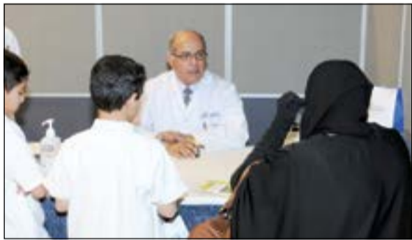
جانب من اللقاء المفتوح مع الاطباء

كما تضمن اللقاء تنظيم دورة متخصصة في الإسعافات الأولية مع تخصيص شهادات للمشاركة في دورة الإسعافات الأولية التي تتعلق بالإنعاش القلبي والذي يعتبر من أكثر