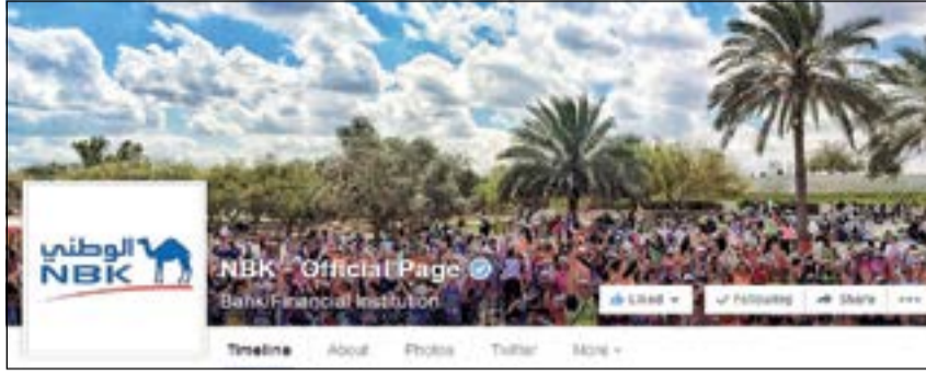
الختم الموثق لصفحة الوطني الرسمية على فيسبوك