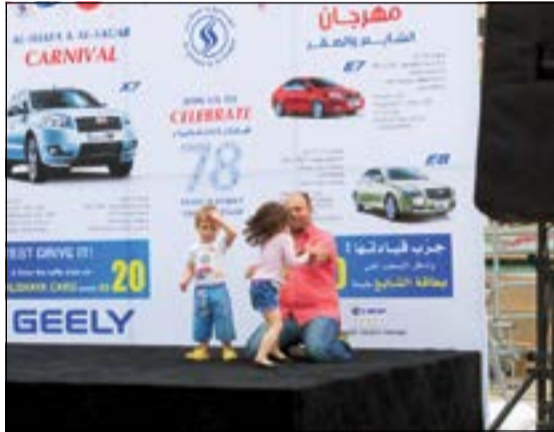
جانب من المهرجان