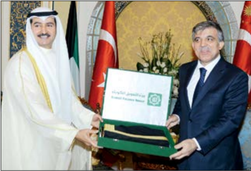
الرئيس غول يتسلم من حمد المرزوق هدية «بيتك»

ما من شأنه تعزيز العلاقات الاقتصادية المشتركة بحيث تكون متطابقا لعلاقات خليجية تركية أوسع وأعمق تتيح سهولة انسياب رؤوس الأموال وتنتقل رجال الأعمال وتعزيز التعاون المشترك والمشاريع المهمة في تركيا والخليج، حيث تتمتع تركيا بوضع جغرافي مميز وتعتبر معبدا للتبادل التجاري بين أوروبا ودول آسيا والخليج العربي. وأعلن المرزوق ان «بيتك» لديه توجه نحو إنشاء شركة استثمارية قابضة يملكها للاستثمار وإدارة الاستثمارات في تركيا برأسمال 150 مليون دولار، ويجري دراسة مختلف الجوانب الأساسية لتحقيق التوجه وبعد أخذ الموافقات الرقابية اللازمة، حيث ان من شأن ذلك تدعيم تواجد «بيتك» في السوق التركي والدخول إلى أنشطة ومجالات عمل جديدة وتحقيق معدلات جيدة من الربحية.