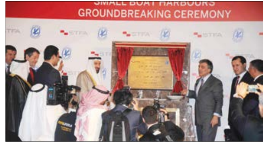
الرئيس التركي عبدالله غول وزير النفط د.علي العمير خلال رفع الستار إيداناً بتدشين المشروع (محمد خلوصي)

وقال المرزوق في تصريح صحفي عقب لقائه الرئيس التركي عبدالله غول بحضور الرئيس التنفيذي لـ «بيتك» رئيس مجلس إدارة «بيتك» تركيا، محمد العمر والرئيس التنفيذي للعمو والمندوب لشركة «تركيباتال» فواز العيسى، ان تجربة «بيتك» في تركيا التي بدأت قبل 25 عاماً بإشياء «بيتك» تركيا مؤسسة مالية إسلامية باستثمارات كويتية - تركية مشتركة، تعد من انجح مشاريع التوسع الخارجي لبيتك، وأثبتت جدوى الاستثمار في السوق