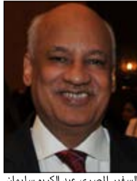
السفير المصري عبد الكريم سليمان

فاقت توكيلات تفويض الترشح في القنصلية المصرية بالكويت كل التوقعات حيث أعلن السفير المصري لدى البلاد عبد الكريم سليمان أن أكثر من 700 مواطن مصري مقم في الكويت قاموا بعمل توكيلات بمقر القنصلية المصرية بمنطقة الروضة خلال أول يومين فقط من فتح الترشح للانتخابات الرئاسية المقبلة والتي يتنافس فيها وزير الدفاع السابق المشير عبدالفتاح السيسي وحمد بن صباحي حتى الآن. وأكد السفير سليمان في تصريحات لـ «الأبناء» أن اليوم الأول لفتح باب التوكيلات أمس الأول شهد تصديق 300 توكيل فيما شهد اليوم الثاني 400 توكيل أغلبها بتأييد للمشير عبدالفتاح السيسي للترشح لرئاسة مصر. وكشف السفير سليمان أنه تمت زيادة عدد ساعات العمل بالقنصلية المصرية في الكويت لإصدار التوكيلات لتصبح من الساعة 8:30 صباحا حتى الساعة 10 صباحا حتى 1:30 والتي كان معمولا بها من قبل. وأشاد السفير