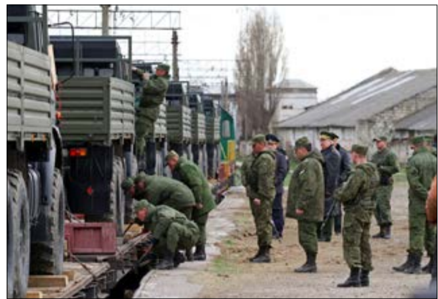
جنود روس يتآمرون لإنزال عتادهم العسكري عقب وصولهم لإحدى محطات السكك الحديدية بالقرب من الأوكراني (أ.ف.ب)

ودول البلطيق. وعلن الوزراء أنهم قرروا تجميد «جميع أشكال التعاون المدني والعسكري العملي بين حلف شمال الأطلسي وروسيا»، وأكدوا اعترافهم بتعزيز التعاون مع أوكرانيا بمساعدتها في تحسين قدراتها العسكرية، مؤكداً أن «وجود أوكرانيا مستقلة وذات سيادة ومستقرة هو مفتاح الأمان الأوروبي - الأطلسي».