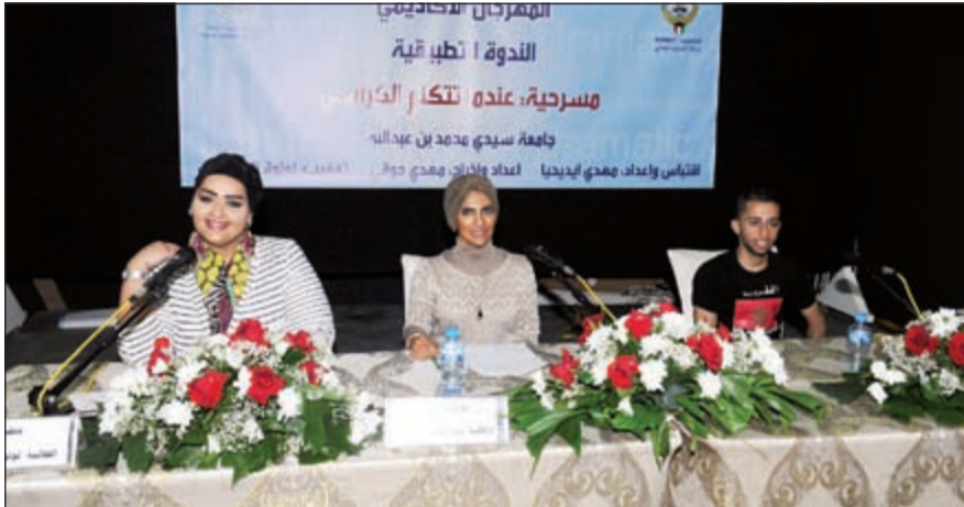
جانب من الندوة التطبيقية