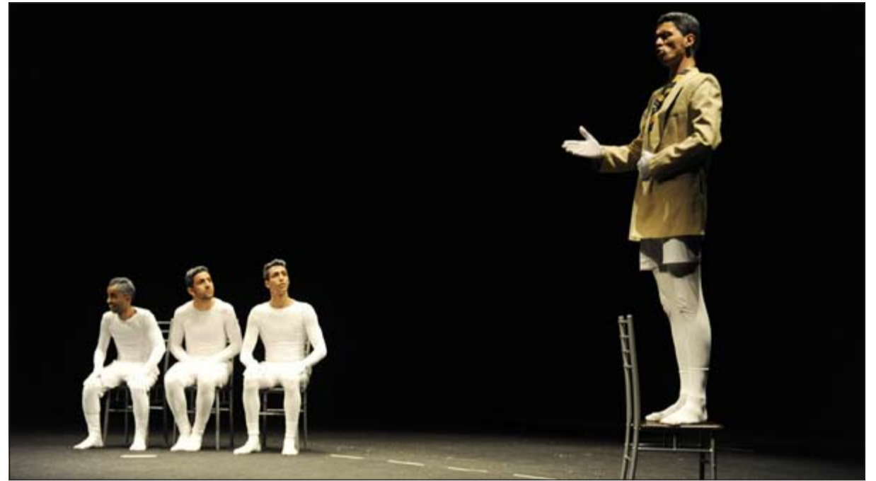
مشهد من العرض المسرحي «عندما تتكلم الكراسي»

وأضافت السعودي: العمل مقتبس من 5 نصوص غير متنوعة إلى جانب شعر لأحمد مطر واستوحى المد أفكاره من الأدب اليوناني ومن نصين من العراق وواحد من قطر وآخر من المغرب، حيث أن لديه فكرة بحث فيها عبر كل الأزمنة والثقافات من ثم استطاع أن يترجمها عبر عمله، وتبدأ المسرحية بجملته «نحن محكومون بالأمل ما يحدث اليوم لا يمكن أن يكون نهاية التاريخ» ما يوضح أن المد يتحدث بين الحقيقة وليس كـ «كراسي».