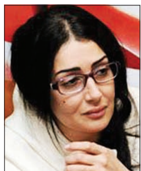
غادة عبد الرزاق