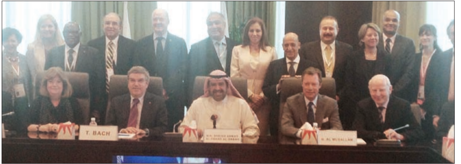
الشيخ أحمد الفهد وتوماس باخ مع أعضاء انوك والقارات الخمس والأمناء فيها