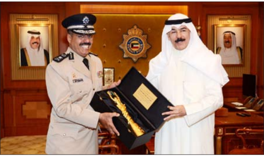
الشيخ محمد الخالد يتسلم درعا تذكارية من الفريق الشيخ أحمد النواف