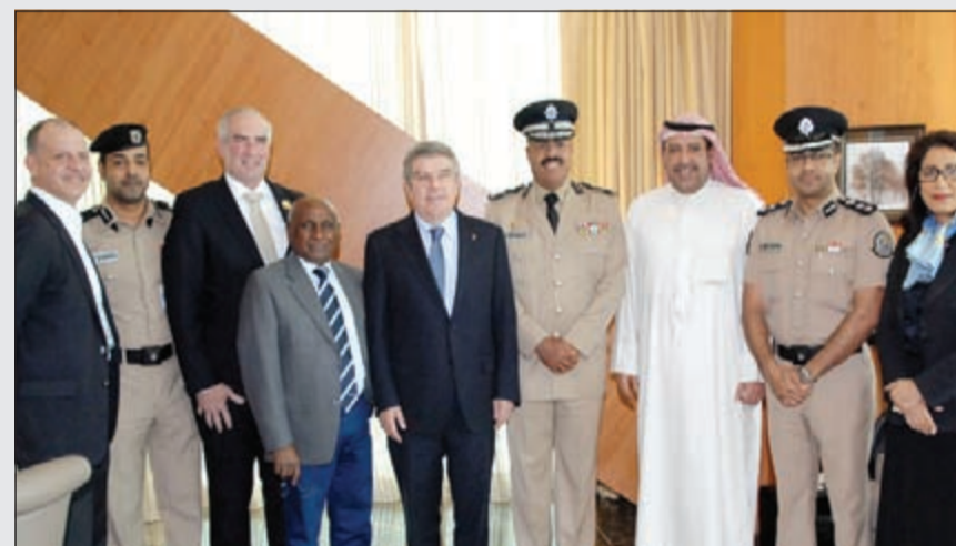
الشيخ أحمد الفهد والفريق الشيخ أحمد النواف وتوماس باخ

الدولي وبحث إمكانية تنظيم فعاليات مشتركة تستخدم منتسبي الرياضة الشرطة في مجال اكتساب وتبادل الخبرات وتطوير المستوى الفني. وتلقى النواف دعوة من باخ لحضور اجتماع اللجنة الأولمبية الدولية الذي سيعقد في مدينة لوزان خلال مايو المقبل لتدعيم العلاقات بين المنظمين وإثارة الفرصة لمزيد من المباحثات التي تتناول المواضيع ذات الاهتمام المشترك.