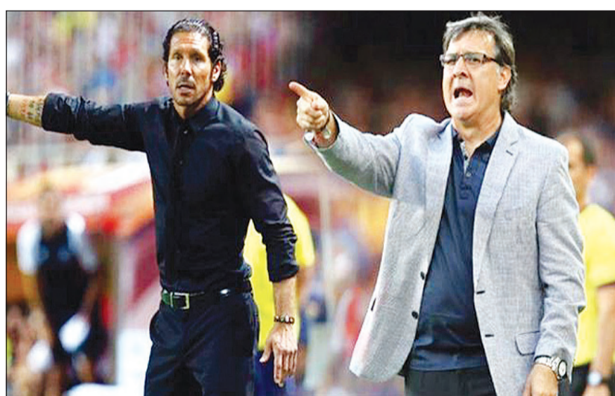
تاتا يسعي لضرب كتيبة سيميوني

يستضيف برشلونة مساء اليوم نظيره أتلتيكو مدريد على ملعب كامب نو في ذهاب ربع نهائي دوري أبطال أوروبا. في هذا السياق تختار لكم «يوروسبورت عربية» حقائق وأرقاماً مثيرة قبل المواجهة المنتظرة: