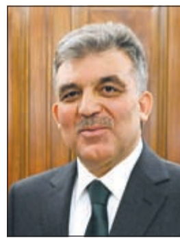
الرئيس عبد الله غول

يصل إلى البلاد اليوم الرئيس عبدالله غول رئيس جمهورية تركيا الصديقة والوفد الرسمي المرافق له في زيارة رسمية للبلاد تستغرق ثلاثة أيام، يجري فخامته خلالها مباحثات رسمية مع صاحب السمو الأمير الشيخ صباح الأحمد. وشكلت العلاقات الكويتية - التركية منذ نشأتها في بدايات القرن الماضي نموناً يحتذى به في العلاقات الدولية وذلك لما اتسمت به من صداقية وتعاون ووحدة رأي في العديد من المواقف والأزمات التي تعرض لها البلدان الصديقان. وارتبطت الكويت وتركيا بعلاقات مميزة وفريدة من نوعها قائمة على الثقة والاحترام المتبادل منذ أيام الدولة العثمانية، ما كان له الأثر الكبير في استقرار الكويت من جهة وفي إيجاد أرضية صلبة ارتكزت عليها العلاقات الكويتية - التركية من جهة أخرى. وتأتي زيارة الرئيس التركي عبدالله غول للكويت لتضع لبننة جديدة في