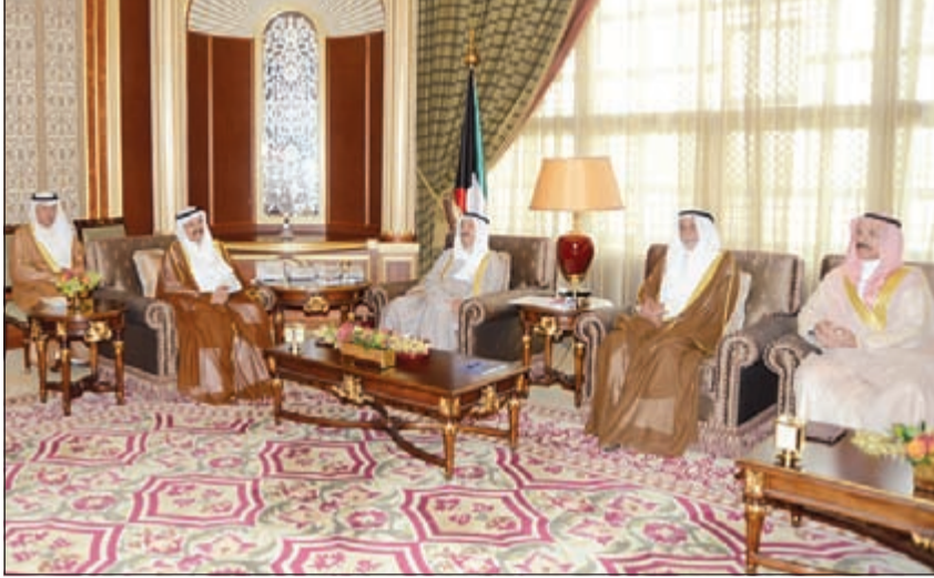
صاحب السمو الأمير الشيخ صباح الأحمد خلال استقباله المستشار فيصل المرشد وأعضاء المجلس الأعلى للقضاء

استقبل صاحب السمو الأمير الشيخ صباح الأحمد بقصر بيان صباح أمس رئيس المجلس الأعلى للقضاء ورئيس المحكمة التمييز رئيس المحكمة الدستورية المستشار فيصل المرشد والمستشارين أعضاء المجلس الأعلى للقضاء. واستقبل صاحب السمو الأمير الشيخ صباح الأحمد بقصر بيان ظهر أمس النائب الأول لرئيس مجلس الوزراء وزير الخارجية الشيخ صباح الخالد. واستقبل صاحب السمو الأمير الشيخ صباح الأحمد بقصر بيان صباح أمس رئيس ديوان المحاسبة عبدالعزيز العدساني. هذا، وبعث صاحب السمو الأمير ببرقية تهنئة إلى الجنرال بيتر كوسجروف حاكم عام أستراليا الصديقة عبر فيها سموه عن خالص تهانئه بمناسبة توليه مهامه الدستورية حاكماً عاماً لأستراليا الصديقة، متمنياً سموه له كل التوفيق والسداد ودوام الصحة والعافية. وبعث سمو ولي العهد الشيخ نواف الأحمد ببرقية تهنئة إلى الجنرال بيتر كوسجروف حاكم عام أستراليا الصديقة ضمنها خالص تهانئه بمناسبة توليه مهامه الدستورية حاكماً عاماً لأستراليا الصديقة. كما بعث سمو رئيس مجلس الوزراء الشيخ جابر المبارك ببرقية تهنئة مماثلة.