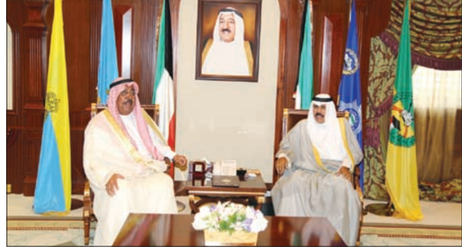
سمو ولي العهد الشيخ نواف الأحمد أثناء استقباله الشيخ جابر الخالد

استقبل سمو ولي العهد الشيخ نواف الأحمد بقصر بيان صباح أمس نائب رئيس مجلس الوزراء وزير الدفاع الشيخ خالد الجراح. واستقبل سموه بقصر بيان صباح أمس رئيس ديوان المحاسبة عبدالعزيز العدساني. واستقبل سموه الشيخ جابر الخالد. كما استقبل سمو ولي العهد رئيس جهاز الأمن الوطني الشيخ فامر العلي.