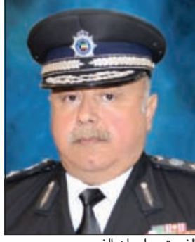
الفريق سليمان الفهد

يعاود وكيل وزارة الداخلية الفريق سليمان الفهد استقبال عددا من المواطنين والمقيمين للتعرف على مقترحاتهم واستفساراتهم وشكاواهم ومعاملاتهم المتعلقة بقطاعات المرور، والجنسية والجوازات، والمؤسسات الإصلاحية وتنفيذ الأحكام بمقر وزارة الداخلية في منطقة شرق من الساعة 8:30 صباح يوم الثلاثاء الموافق 2014/4/1 وذلك بحضور وكيل وزارة الداخلية المساعد لشؤون الجنسية والجوازات اللواء فيصل النواف ووكيل الوزارة المساعد لشؤون المرور اللواء عبد الفتاح العلي، ومدير عام الإدارة العامة للمؤسسات الإصلاحية اللواء خالد عبدالله الدين، ومدير عام الإدارة العامة للهجرة العميد عدنان الكندي، وعدد من مديري الإدارات في القطاعات المعنية.