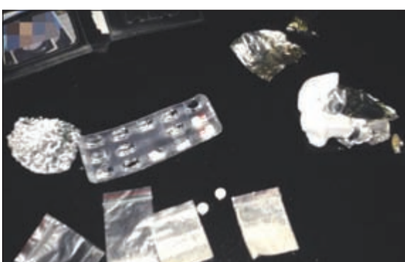
الحبوب والهيروين المضبوطة مع مخالف الخطوط