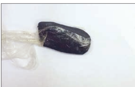
قطعة حشيش عثر عليها مرور حولي في مركبة الدعامية