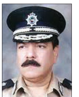
اللواء عبدالفتاح العلي