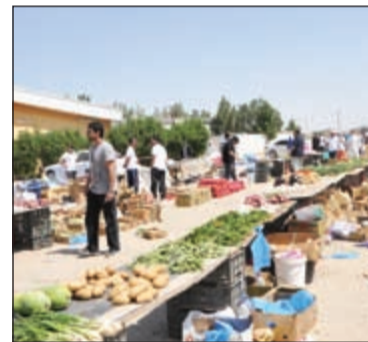
الحملة شملت سوقا عشوائية لبيع الخضراوات