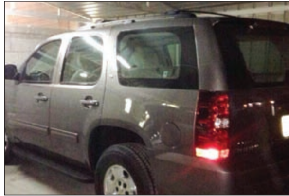
صورة للمركبة المسروقة كان يحتفظ بها المواطن على هاتفه المحمول

كتبت النجاة لمواطن اصيب بكسور بعد ان سرت سيارته امام عينيه في منطقة العماثر الاستثنائية مساء امس الأول وتم تسجيل قضية الشروع بالقتل في مخفر الجهراء الشمالي. وقال مصدر امني ان بلاغا ورد الى غرفة عمليات الداخلية من مواطن يفيد بان سيارته سرقت امام عينيه وانه اصيب بسبب سرققتها ليامر قائد منطقة الجهراء العقيد صلاح الدعاس رجاله بالتوجه الى موقع البلاغ ليتم اسعاف مالك السيارة المسروقة الذي قال انه ترجل منها امام احد البنوك تاركا سيارته التشغيل ليشاهد شخصا