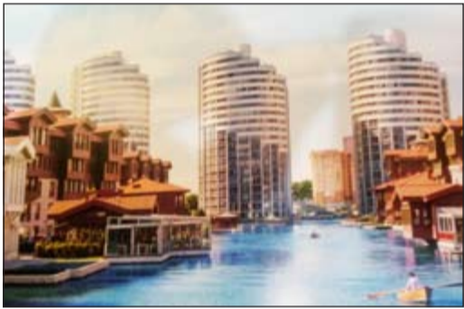
مشروع بسفور سيتي

صرح نائب رئيس مجلس الإدارة والعضو المنتدب لشركة سينية والمدير العام لشركة جولدن جيت معزز السيسى بأن مشروع سينية الذي أطلقته الشركة العام الماضي حقق نجاحات عالية المستوى وشهد إقبالا كبيرا من العملاء فالمشروع السياحي الأول الترفيهي الذي تقدمه الشركة بهذا التكامل