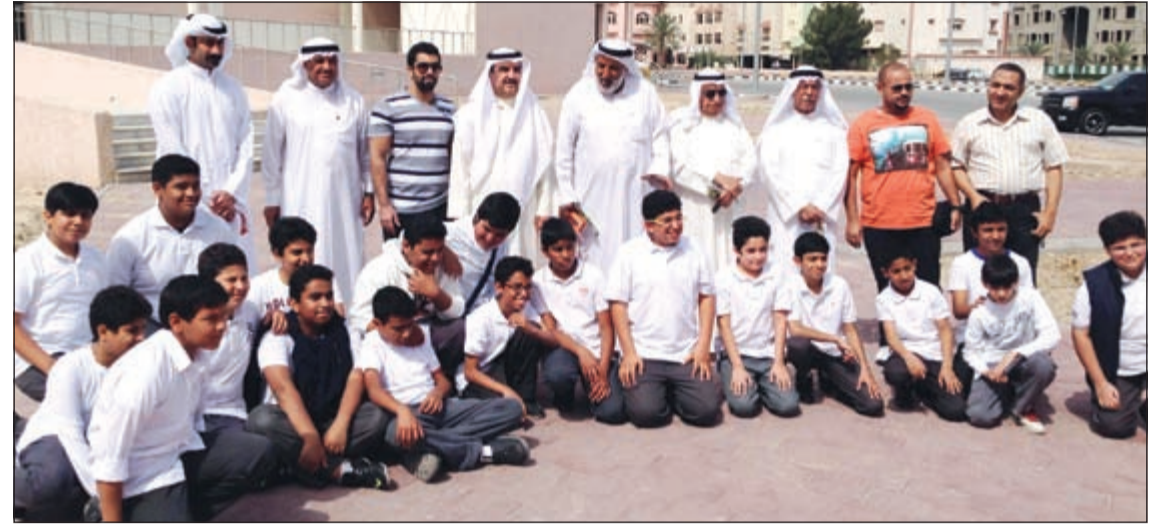
مجموعة من الطلبة والأهالي المشاركين في تخضير المنطقة

أعلن المدير العام لشركة التيميد ميديكال جروب د.خالد الخياط عن نية الشركة عقد العديد من الندوات وورش العمل العلمية، كخدمة متميزة لأطباء الأسنان في كلا القطاعين العام والخاص. وأوضح الخياط في تصريح له على هامش الورشة العلمية التي أقامتها شركة «التيميد ميديكال جروب» في فندق موفتبيك البدع، لأخصائيي تقويم الأسنان بحضور نحو 55 طبيباً، وامتدت من الرابعة عصراً وحتى التاسعة والنصف مساءً، أنه تم خلالها إلقاء محاضرتين من قبل المحاضر العالمي الذي يحاضر في مختلف دول العالم المتقدمة ومنها أميركا وأوروبا والشرق الأوسط وعدد جامعات، المحاضر بقسم التقويم بجامعة القديس يوسف بلبنان، د.جوزيف بو سرحال. وأن المحاضرة الأولى تناولت بداية الطرق العلاجية الحديثة للأسنان، مبيناً أن الخبر العالمي أوضح أن الأمر لا يتم فقط من خلال معاينة الأسنان وإنما بفحص الوجه بالكامل من الجانب الجمالي، والاهتمام به من جانب الطبيب المعالج. وأشار الخياط إلى أن المحاضرة الثانية كانت عملية أكثر، حيث شملت استعراضاً للكثير من الحالات التي قدمها