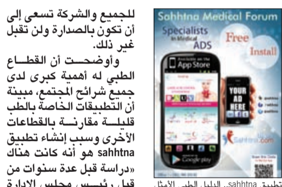
تطبيق sahhtna.. الدليل الطبي الأمثل