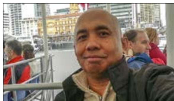
الطيار للغز الذي أثار جدلا

جديد يشي بعكس ما توصلوا إليه حتى الآن. يذكر أن مدير مكتب التحقيقات الفيدرالي الأمريكي «إف بي أي»، جيمس كومي، أعلن أن خبراء المكتب سينتبهون من تحليل جهاز محاكاة الطيران الخاص بقائد الرحلة «إم إتش 370»، الماليزية المنكوبة، في غضون يوم أو يومين. وأوضح كومي أثناء جلسة استماع في الكونغرس الأميركي، قائلا: «لقد قمنا كل المساعدة التي كان