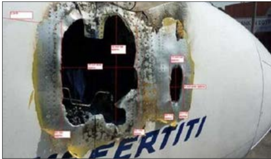
مقدمة الطائرة وآثار الحريق عليها

لندن - العربية: كل تصور عن إمكانية انتحار قائد الطائرة الماليزية قد ينهار إذا ما تم التأكد من أن في طائرات «البوينغ» 777 - 200، عطلا أدى لاختفائها المحير، ففي 29 يوليو 2011 حدث لطائرة مصرية، من الطراز نفسه، حريق بقمرة قيادتها كان سيؤدي إلى سيناريو يتصورون أنه حدث للطائرة الماليزية، لولا أن «المصرية» كانت وقتها تستعد للإقلاع، وعلى متنها 250 راكبا إلى جدة لاداء مناسك العمرة في مكة المكرمة.