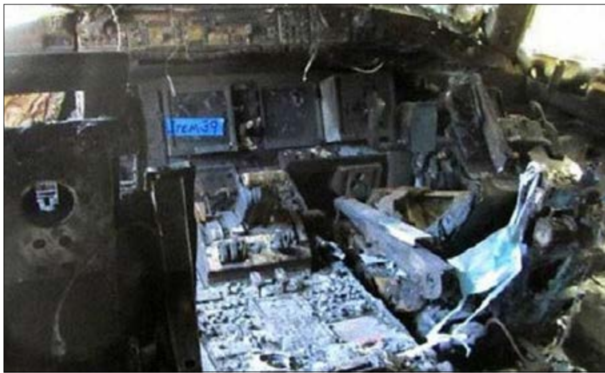
كابينة الطائرة وقد احترقت بالكامل

الأفقية على معظم المناطق كما تكون الفرصة قائمة لسقوط أمطار تكون رعدية أحيانا على بعض المناطق خصوصا في وقت متأخر من ليل السبت والساعات الأولى من نهار الغد. وأضاف ان هذا الوضع غير المستقر سيكون تأثيره واضحا على أمواج البحر التي ستشهد ارتفاعا يتجاوز ست اقدام. وأفاد بأن إدارة الأرصاد الجوية ستقوم بمتابعة آخر المستجدات على حالة الطقس وموافاة المواطنين والمقيمين بها وإصدار التحذيرات الجوية اللازمة في حينها.