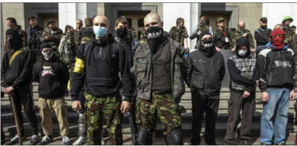
أعضاء في جماعة «القطاع الايمن» القومية المتطرفة خلال تظاهرة احتجاج امام البرلمان الأوكراني في كييف أمس

الذين يحاولون إضعاف نفوذ روسيا في أوكرانيا. ونقلت الوكالة عن الكسندر ماليفاني نائب رئيس جهاز الأمن الاتحادي قوله «هناك زيادة كبيرة في التهديدات الخارجية للدولة. الرغبة المشروعة لشعوب القرم ومناطق شرق أوكرانيا تسبب هيبستيريا في الولايات المتحدة والدول الحليفة لها». من جانبها، وصفت وزارة الخارجية الروسية في بيان لها أمس القرار الذي أصدرته الجمعية العامة للأمم المتحدة بشأن الأحداث في أوكرانيا والقرم «بالأحادية»، معتبرة أن مبادرة إصدار القرار ستعرقل تسوية الأزمة الداخلية في البلاد، حسما اوردت قناة (روسيا اليوم). ووصف مندوب روسيا الدائم لدى منظمة الأمن والتعاون الأوروبي أندريه كيلين، الانتخابات الرئاسية الأوكرانية المزمع إجراؤها في مايو المقبل بأنها «غير شرعية».