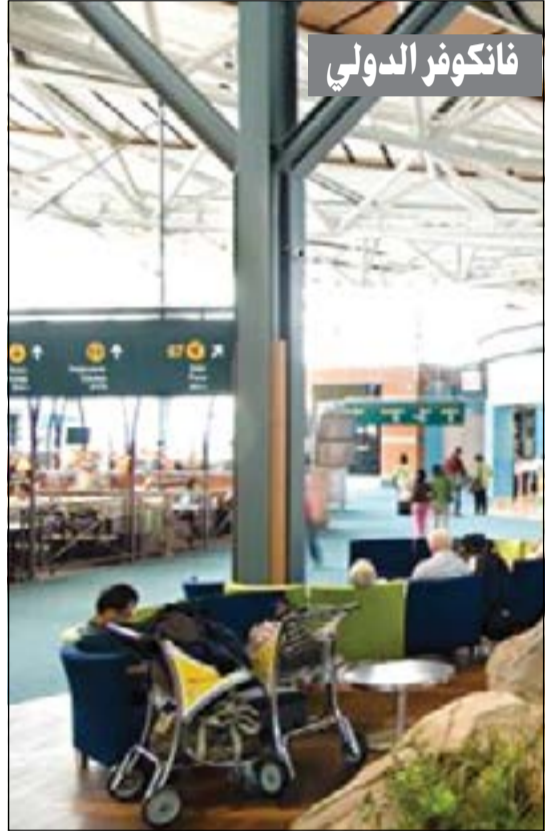
«فانكوفر الدولي» بكندا.. عدد الركاب: 18 مليون سنويا.