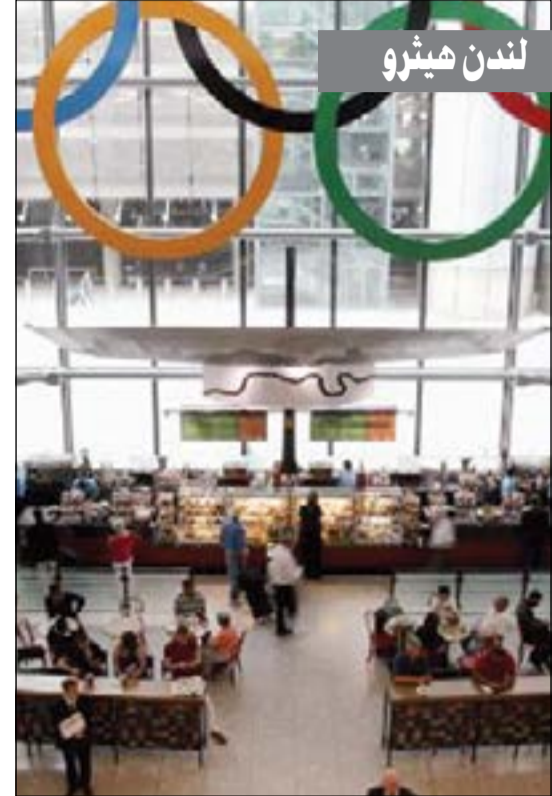
لندن هيثرو، في إنجلترا.. عدد الركاب: 69,4 مليون سنويا.

تصدر مطار «شانغي» في سنغافورة قائمة «سكاكي تراكس» لأفضل مطارات العالم للعام الثاني على التوالي، كما سيطرت المطارات الأوروبية والآسيوية على المراكز الأولى.