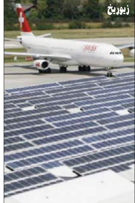
«زوريخ» في سويسرا.. عدد الركاب: 24,8 مليون سنويا.