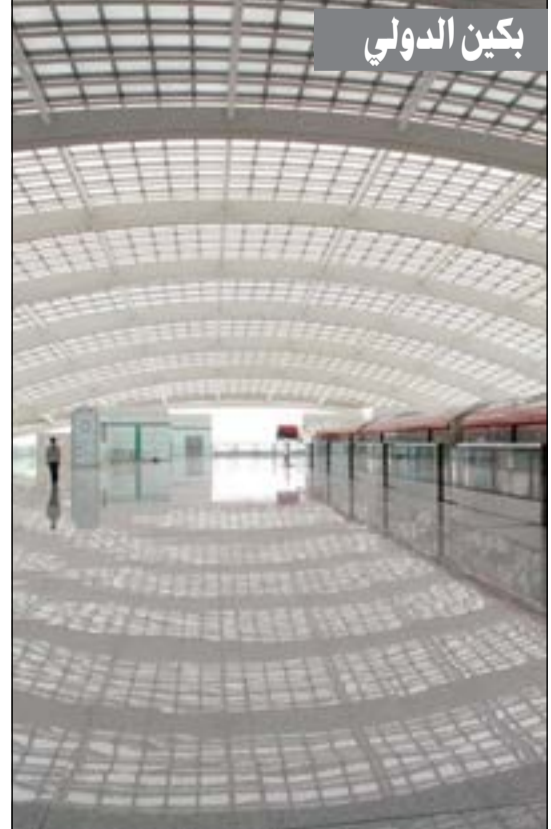
«بيكين الدولي».. عدد الركاب: 78,7 مليون سنويا.