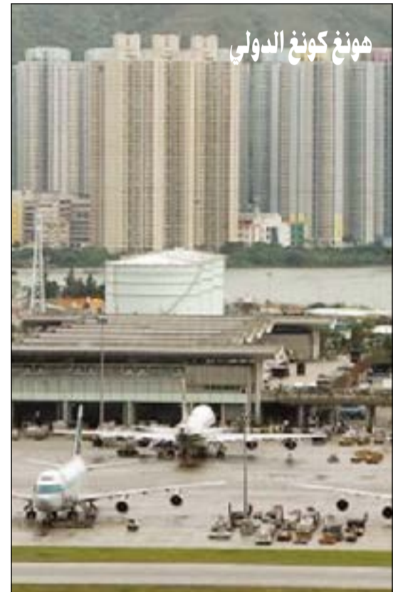
«هونغ كونغ الدولي».. عدد الركاب: 53,3 مليون سنويا.