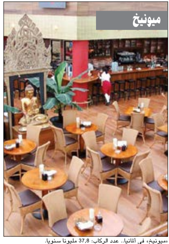
«ميونيخ» في ألمانيا.. عدد الركاب: 37,8 مليون سنويا.