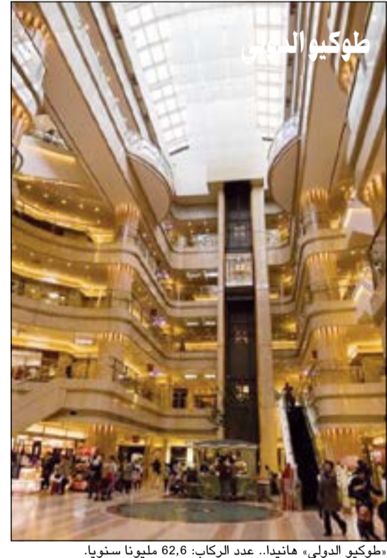
«طوكيو الدولي» هايتدا.. عدد الركاب: 62,6 مليون سنويا.