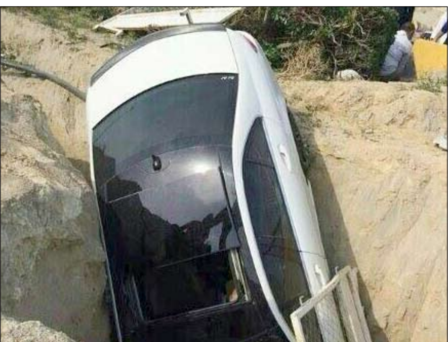
ثمرة الانشغال بالهاتف سقطت في الحفرة