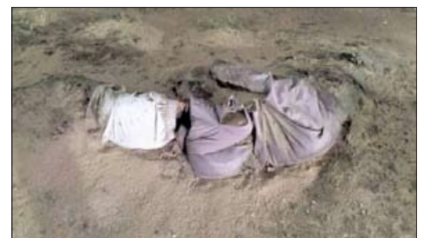
الجثة أحيلت إلى «الأدلة» لتحديد سبب الوفاة

الأديرع إلى جانب تحديد سبب الوفاة، وكانت عمليات وزارة الداخلية تلقت بلاغاً عن وجود جثة ملقاة في منطقة الأديرع طريق اللباج، فتوجه على الفور رجال أمن الجهراء والمباحث والأدلة الجنائية إلى الموقع، مشيراً إلى أنه شوهدت جثة لشخص مجهول الهوية، لا سيما أن الجثة شبه متحللة ويرتدي الزي الوطني (الدشداشة)، بالإضافة إلى ملابس داخلية. وقال مصدر إن المعاينة الأولية للجنة كشفت عن أنها ربما تكون لراعي أغنام، مؤكداً أنهم بانتظار تقرير الأدلة الجنائية لمعرفة هوية المتوفي.