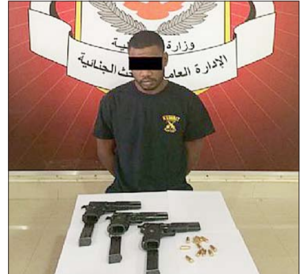
الأسلحة المسروقة ضبطت بحوزة وكيل عريف

أعلنت إدارة الإعلام الأمني بوزارة الداخلية عن العثور على المسدسات الـ3 والطلقات والتي