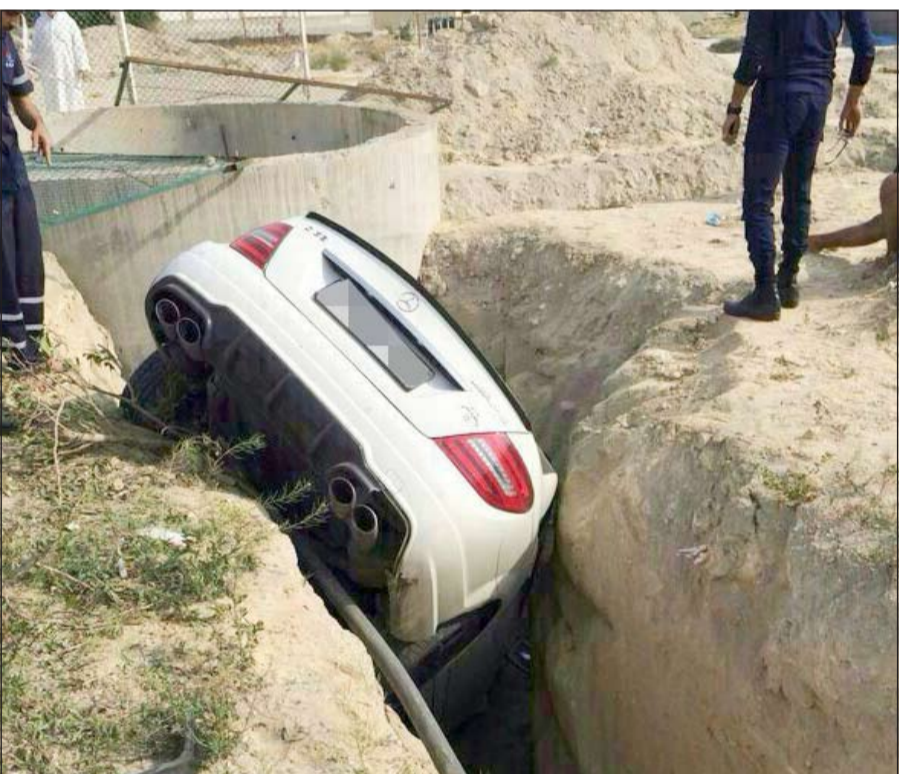
الفتاة أصيبت بجروح وخدوش بسيطة

فريق العمل الذي أخرج الفتاة من الحفرة مع حادث انقلاب مركبة على حط الوفرة، وتم انقاذ قائد المركبة وهو مواطن حيث تم نقله بسيارة إسعاف إلى مستشفى العدان ووصفت أصابته بالرجة.