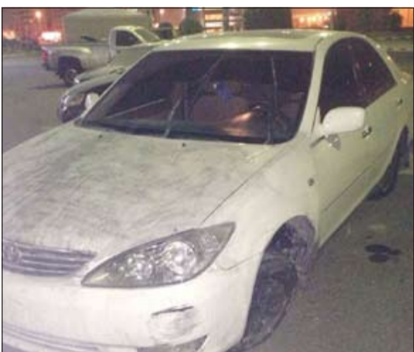
الجثة أحيلت إلى «الأدلة» لتحديد سبب الوفاة

رقم الشاصي تبين أن المركبة مسروقة وتم العثور على هاتفه وأدوات تعاط.